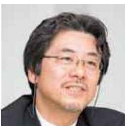
国際交流基金 日米センター 所長 Executive Director, The Japan Foundation Center for Global Partnership

一つの交流プログラムが継続実施されていく背後には、多くの関係者の熱意とご協力、そして献身があります。JOIプログラムもその例外ではありません。15周年の節目に、これまでJOIのアドバイザー、派遣先のスーパーバイザーとしてご尽力いただいた方々に、あらためて御礼を申し上げたいと思います。また、共催団体である米国ローラシアン協会、そして、JOI派遣先を管轄地とする日本の在外公館並びに外務本省関係者の方々にも、謝意を表させていただきます。そしてこのJOIの核であり、日米地域・草の根交流の直接的な担い手となって活躍いただいた、第1期から現在派遣中の第15期までのコーディネーターの皆様一人一人に対し、主催団体としての御礼の言葉を申し上げます。JOIプログラムが今後更に発展を続け、日米地域・草の根交流と相互理解の進展に資するよう、日米センターは努力してまいります。引き続き、各方面からのご指導、ご鞭撻をお願い申し上げます。