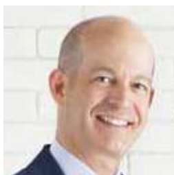
ローラシアン協会 会長