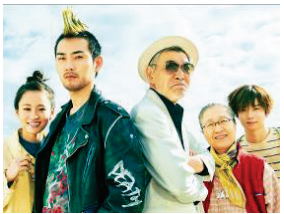
モヒカン故郷に帰る