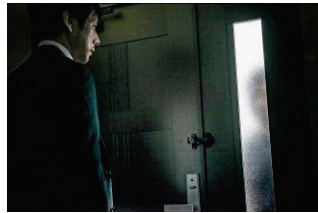
クリーピー 偽りの隣人