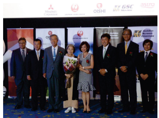
セレモニーの様子

「JFF (Japanese Film Festival: 日本映画祭) アジア・パシフィック ゲートウェイ構想」の一環として、9月6日(火)にマレーシア・クランバレーで「JAPANESE FILM FESTIVAL 2016」のオープニングセレモニーが開催されました。これに、女優の樹木希林さんが同日に上映された映画『海よりもまだ深く』の出演者として出席。樹木さんの出演作はマレーシアでも多く上映されており、会場には多くのファンが詰め掛けました。映画祭に来たマレーシアのファンを前に、樹木さんは、「今回、日本の片隅で生きている親子の映画に出させてもらいました。出来の悪い息子を持つ母親の役ですが、そうだと思いたくないんですね。誰でもそうでしょうけど、母親にとって息子は本当にかわいいという、そんな気持ちで演じました。面白く見てください。」と語りました。また翌7日(水)には、主演映画『あん』特別試写会のゲストとしても登場し、観客から寄せられた多くの質疑応答に応じるなど交流を楽しみました。