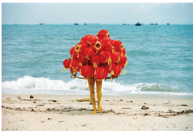
リー・ウェン《奇妙な果実》 2003年

本展は、時代の潮流と変動を背景とした東南アジアにおける1980年代以降の現代アート的发展を9つの視点から掘り下げ、そのダイナミズムと多様性を紹介しています。