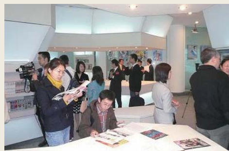
「成都ふれあいの場」オープニング

材など）、映像資料（J-POPのライブ映像など）の閲覧が可能で、インターネットを通じた情報提供に加え、浴衣の着付けや生け花など、日本文化に関するイベントなども開催されています。