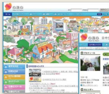
「心连心」トップページ

生の視点で中国に紹介するという一面も持ち、日中交流センターの事業を象徴する存在にもなっています。