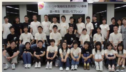
第一期生来日直後の歓迎レセプションにて