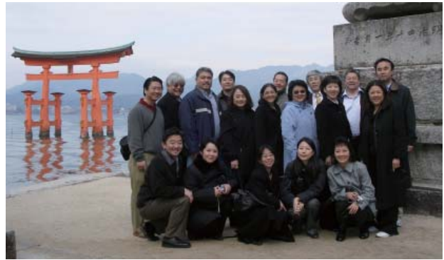
世界遺産、厳島神社にて