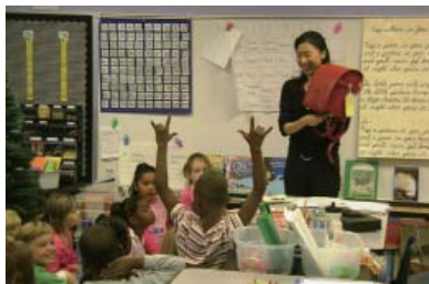
ランドセルって知ってる? (アラバマ)