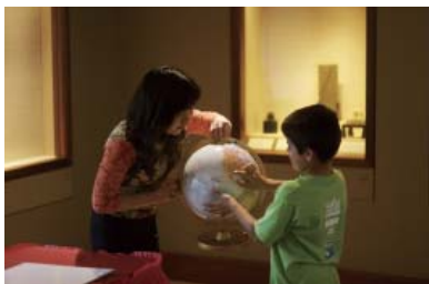
日本はどこかな? (テキサス)

2006年度には、新たに3名のコーディネーターをアラバマ日米協会（アラバマ州）、ベサニー大学（ウェストバージニア州）、モリカミ博物館（フロリダ州）に派遣しました。これらコーディネーターによる企画事業に参加した人々は、2006年8月から2007年1月までのべ2万名をこえ、子供から大人までの一般市民のほか、初等・中等教育関係者まで多岐にわたっています。