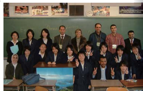
広島市内の中学校を訪問して交流

中東諸国では、初等教育を受けられない貧困層の存在や、教育を受けた若者の就職難が深刻な社会問題になっています。フェローたちは、日本の経済力や高度な技術に関心を示しつつ、日本と自国が抱える共通の課題を見出し、日本の経験に学ぼうとする強い意欲を見せました。3週間という短い期間ではありましたが、それぞれがレポートをまとめ、帰国直前の最終報告会では多くの聴衆を前にプレゼンテーションを行いました。