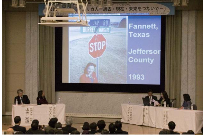
広島での公開シンポジウム

2007年3月に訪日した13名は、東京にて日本の各界の指導者と意見交換を行った後、京都、広島を訪問しました。広島では広島平和記念資料館を見学し、被爆者の体験談を聞き、さらに180名の聴衆を集めた公開シンポジウムおよび市民との対話事業に参加しました。招へいされた日系人リーダーは日本との結びつきを強めるとともに、彼ら同士のネットワークの発展にも意欲を見せており、2007年夏に参加者自身の発案による同窓会が開催されます。