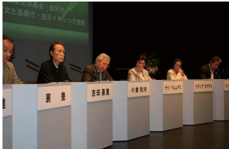
公開シンポジウム(金沢21世紀美術館)

今回の文化サミット開催にあたっては、金沢市の協力により伝統的な建築様式による文化施設(中村記念美術館内旧中村邸)と日本を代表する現代建築(金沢21世紀美術館)が会場として提供されました。参加者はそれぞれの会場の設えや雰囲気にも刺激を受けつつ、日墨両国が歴史と共に