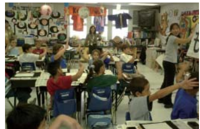
お習字できるかな (フロリダ)