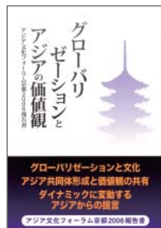
アーバン・コネクションズ 発行、2007年