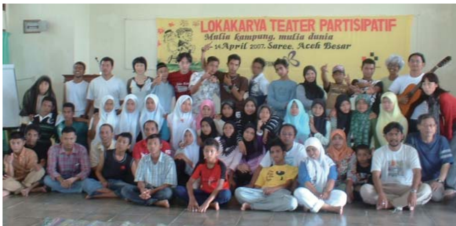
参加者全員で記念撮影。ワークショップ最終日には、別の地域から来た友人との別れを惜しみ、涙が止まらなくなってしまった子どもも

成功の手ごたえを実感しました。今後は、生徒らの活動を周囲の大人や地域社会全体がサポートする体制を構築するには何が必要かを考慮しながら、引き続き支援したいと考えています。