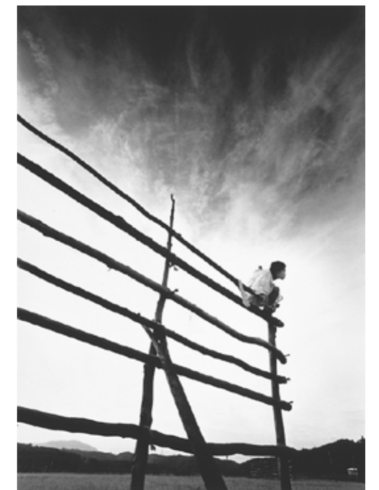
1 米田知子《Topographical Analogy; Wallpaper IV》1998 2 杉山晶子《In-spiral II》1998 3 安田千絵《into a vortex; Untitled》1996 4 石原友明《UNTITLED (#195)》1998 5 杉本博司《Chapel de Notre Dame du Haut, Le Corbusier》1998 6 細江英公《鎌鼬 #8》1965