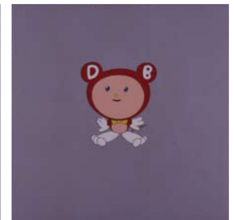
1 小林孝亘《Dog》1998 2 丸山直文《Untitled》1995 3 福田美蘭《キューピーマヨネーズ》1997 4 奈良美智《In the White Room II》1995 5 太郎知恵蔵《Boy I》1997 6 村上隆《I can't touch (blue & red)》1996