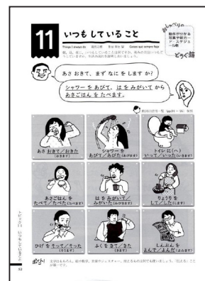
『にほんごこれだけ！2』 p.52

http://www.cocopb.com/koredake/ に、この本を使ったおしゃべり型教育の様子が動画で紹介されているので、始めての方には参考になるでしょう。