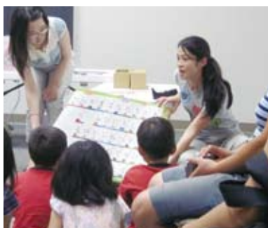
▲ ジャパニーズ・ストーリータイム

集まってくれたことに加え、身近な場所での国際交流の機会を活用しようとお子さんを連れてきてくださるアメリカ人の親御さん、初めて耳にする日本語の響きに興味津々でやってきてくださる方、また、紙芝居の手法と大きな紙芝居カードの絵に魅了されて毎回楽しみに来てくださる方、それぞれにプログラムの利点を見つけていらっしゃる人が大勢いて、図書館の中でも人気のプログラムと