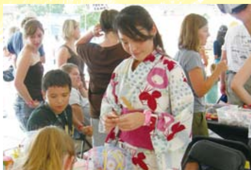
▶ アートフェスティバルで折り紙の紹介

派遣されたコミュニティで求められるニーズを探し、そこを埋めていく、という作業はとても有意義でした。そして今、新たな年度になり、このプログラムが学生と地元ボランティアの方々の手によって継続されていると聞き、とても嬉しく思います。こんなところに草の根レベルで活動できるJOIらしさがあるのだと改めて実感しています。アセスンズに派遣されたことに意味を見出せて帰国できたことに感謝しつつ、この経験を今後違った形で活かしていければと思います。