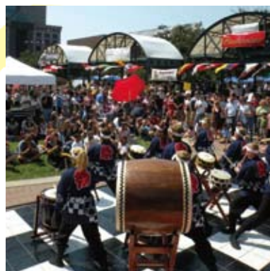
▶ World Festで招いた太鼓グループ

この場を借りて国際交流基金やローラン協会、大学や日米協会、地域のボランティアの皆様へ厚くお礼を申し上げます。本当に2年間どうもありがとうございました。