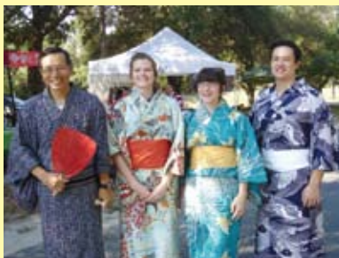
▲ タンパ夏祭りで学生と

タンパは、人口34万人、州では3番目に大きな都市(フリー百科事典ウィキペディア『Wikipedia』)ですが、日米協会も日本企業もまったくありません。また、公式の日本人コミュニティ也没有なので、すべてが手探りの中で、アウトリーチ活動(学校やコミュニティを訪問して日本文化を紹介するプレゼンテーション等を行なうこと)を始めました。新聞、インターネット記事で、日本文化・交流に関する記事を見つけては押しかけ訪問し、タンパに来た理由と共に自己紹介をして、ネットワーク作りを始めました。