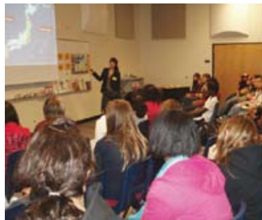
▲ 中学校の大教室でプレゼンテーション

そして、何より私自身この経験を通して学んだことがあります。1年目は何を活動の主体にしていかわからずに学校訪問ができることを手当たり次第に当たるという方法で、一人で連絡をとり、一人で学校に行き、