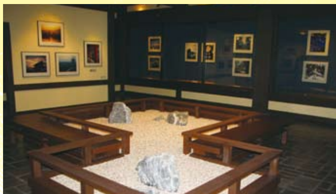
▶ ディズニーワールド「日本館」内での写真展

フロリダにおける集客力が最大の展示施設は、オーランドにあるディズニーワールドです。その中の施設の一つ「エプコット」には、万博をイメージさせる「ワールドショーケース」という場所がありますが、その「日本館」には日本を紹介