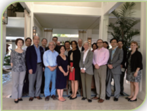
The ADC members and staff meet in Honolulu in January 2013 to establish recommendations to promote arts exchange.

Two key occasions, the 70 th anniversary of the end of the war (2015), and Tokyo Olympic and Paralympic games (2020), should serve as goal posts for achieving the fundamental aims of the ADC and CULCON.