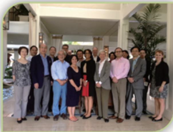
2013年1月ホノルルで美術交流の推進に向けた提言を策定する会合に出席した美術対話委員会メンバーとスタッフ

美術対話委員会は、日米両国間の美術および美術館・博物館交流を促進・改善することで、美術界に目に見える形で貢献を行ってきた。同委員会は、これらの貢献に加え、例えば、美術品の損害に対する国家補償制度等、美術界に現れた様々な課題に関する意見交換を促すための、他に類を見ない日米間のフォーラムも開催している。同委員会は今後2年間にわたって、引き続き定期的に会合を持ち、特定の分野とプログラムについて具体的な成果を生み出すことを目指すべきである。