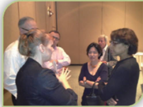
U.S. members and staff of the ADC caucus in January 2013 about curatorial exchange.