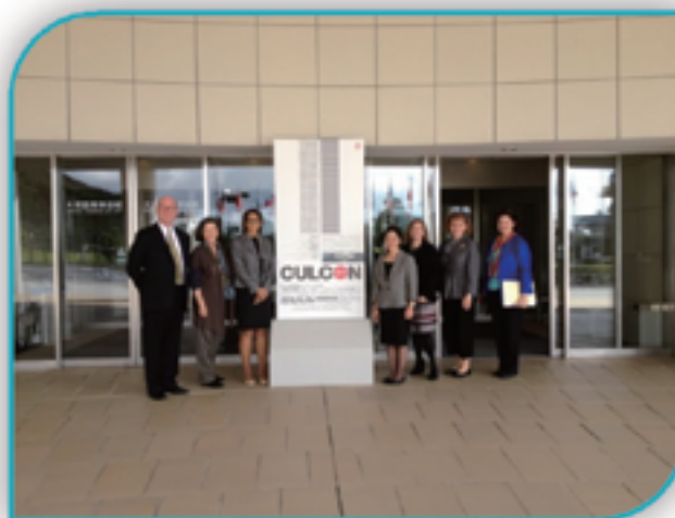
U.S. ADC Members and staff at the Otsuka Museum for the CULCON Symposium in October, 2013

The binational Arts Dialogue Committee (ADC) is a forum that has allowed representatives from U.S. and Japanese private and public institutions to air differing points of view and to reach greater understanding on important issues such as the critical need for support for a new generation of Japanese art specialists in the United States, indemnification, needs and methods of fundraising, and effective means for the promotion of contemporary art.