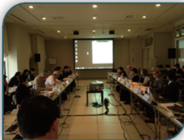
The October, 2013 binational meeting of the ADC in Naruto-shi, Japan

1.2 Considering that the promotion of curatorial exchange is vital to developing Japanese art experts in the U.S., the Arts Dialogue Committee applauds that a workshop was successfully held in Japan on Japanese traditional art for current American curators, utilizing human resources including JAWS alumni. The Arts Dialogue Committee has also reaffirmed the