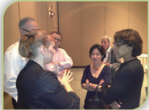
2013年1月に美術対話委員会の学芸員交流に関する幹部会議に参加する米国側のメンバーとスタッフ