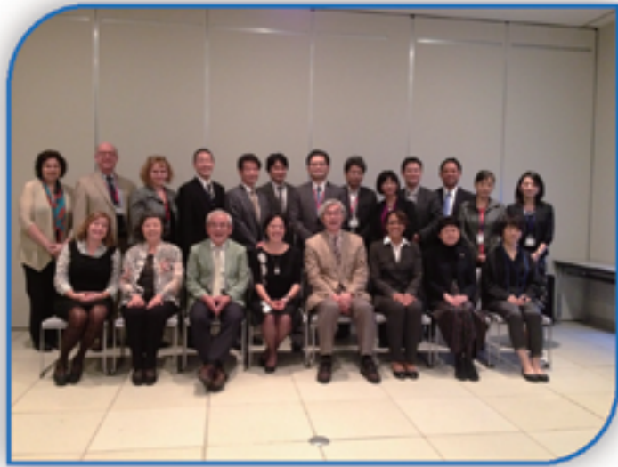
The Arts Dialogue Committee members and staff in Naruto-shi, Japan in October, 2013.

Following CULCON's valuable role as incubator of collaboration, the ADC should explore other organizations with which to partner in continuing and expanding the important work it has begun.