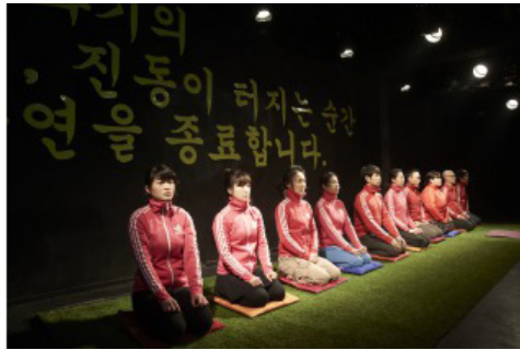
ユン・ハンソル『語りの方式、歌いの方式—デモバージョン』