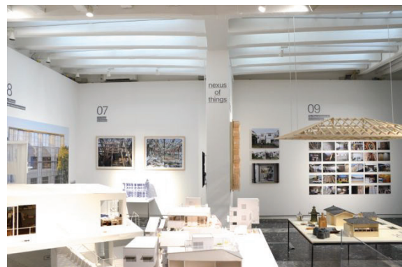
日本館の様子