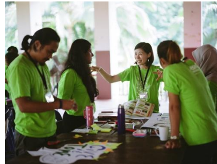
写真：（左より）2016年度実施の地図を作るワークショップ、ディスカッションを通じて学びあいを深める

東北では、仙台、石巻、女川を訪問し、いまだなお残る課題を知り、そこに住む人とともに解決策を考えることを通じて、フェロー自身が自国に戻った後も地域に根ざした活動を実施できる能力を身に付けます。石巻では、NPOの「石巻2.0」との課題解決ワークショップなどを通して、具体的なアクションプランに落とし込むためのディスカッションを実施します。