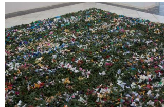
レニール・レイバ・ポパ 《Untitled (military and civilians)》 2018**