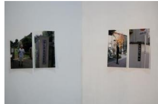
田代 一倫 《第三の接触—東京》 2018*