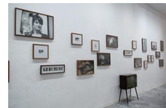
レアンドロ・フェアル 《Life already changed》 2017*