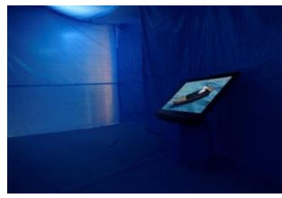
高嶺 格 《歓迎されざる者》 2018*