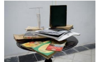
岩崎 貴宏 《テクトニック・モデル（寓話のよう）》 2018*