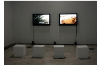
ミヤギトシ 《ロマン派の音楽》 2015**