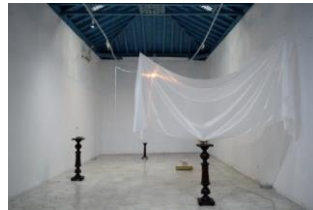
毛利 悠子 《polar-oid(o)》 (白くまと感光紙) 2018*