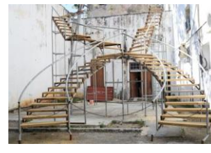
持田 敦子 《Further you go, you may fall or you may learn》 2018*