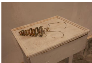
ホセ・マヌエル・メシアス 《From the series Verses and Theorems》 2009**