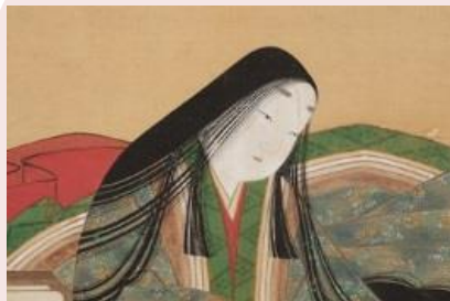
土佐光起筆 《紫式部像》(部分) 17世紀、石山寺蔵

本展覧会は、各国語に翻訳され、国境や世代を越えて愛される『源氏物語』が生み出した壮大な美の世界を紹介するユニークな展覧会です。日本文学史上最高傑作と目される『源氏物語』はそのストーリーが受け継がれてきただけでなく、これまで、小さな画帖や絵巻物・扇面から、大胆な意匠が施された掛軸や屏風まで、あらゆる形で表現され続けてきました。また、物語の有名な場面は、着物や蒔絵箱・化粧道具箱から、駕籠までをも彩り、『源氏物語』を主題にした美術工芸品は膨大な点数にのびります。