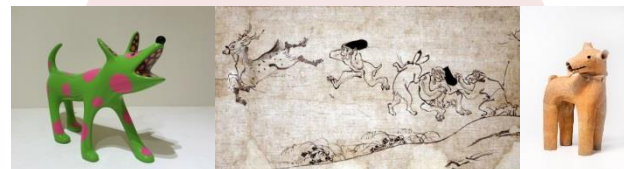
草間彌生《SHO-CHAN》 2013年 ©YAYOI KUSAMA. Courtesy of Ota Fine Arts Tokyo/Singapore/Shanghai