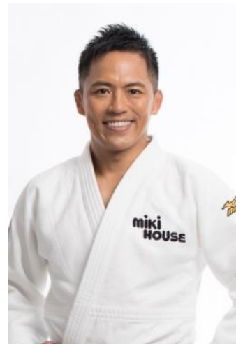
野村忠宏氏