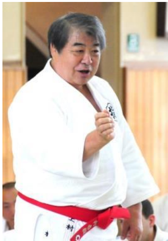
上村春樹講道館長

本講習会ではモンリオール五輪（1976年）金メダリストで講道館長の上村春樹氏と、アトランタ（1996年）、シドニー（2000年）、アテネ（2004年）五輪で3連覇を成し遂げた野村忠宏氏が、柔道大国であるフランスの指導者や青少年を直接指導し、柔道を通じた日仏交流を展開します。