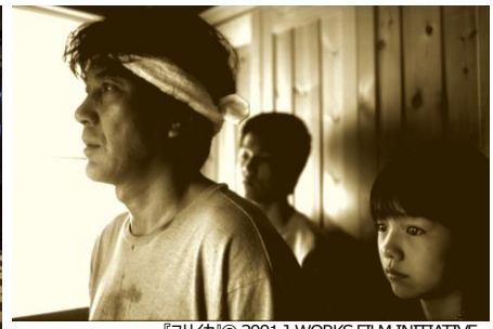
『ユリイカ』