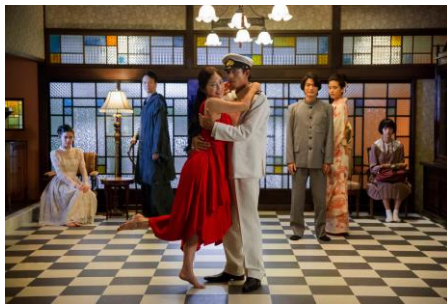
『花筐／HANAGATAMI』©唐津映画製作委員会／PSC 2017