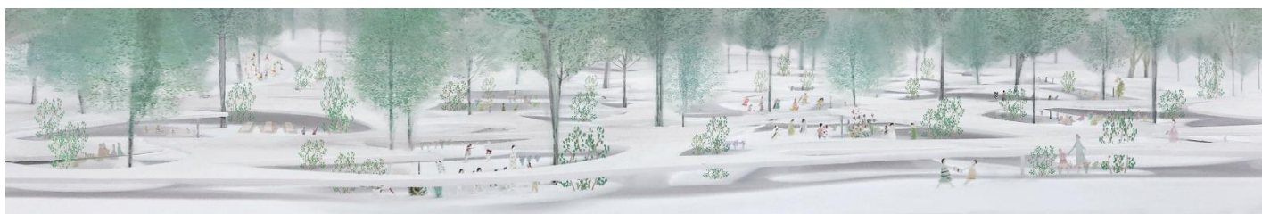
安藤忠雄 《和美美術館》 2020年 仏山（中国）