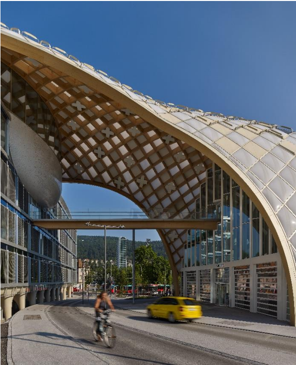
© Didier Boy de la Tour