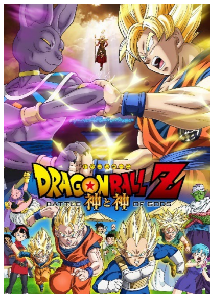
ドラゴンボール Z 神と神