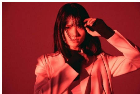
sajou no hana