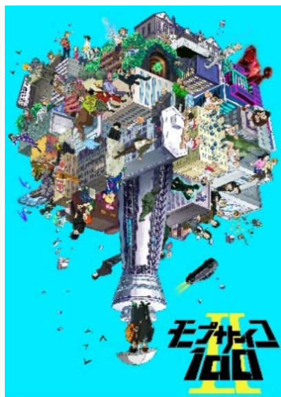
モブサイコ 100 II