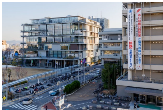
茨木市文化・子育て支援複合施設 おにクル（2023）