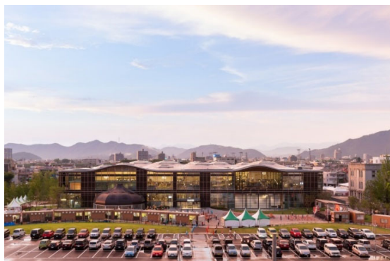
みんなの森 ぎふメディアコスモス（2015）

ヴェネチア・ビエンナーレ金獅子賞、王立英国建築家協会（RIBA）ロイヤルゴールドメダル、プリツカー建築賞などを受賞。2011 年にこれからのまちや建築のあり方を考える場として私塾「伊東建築塾」を設立。自身のミュージアムが建つ愛媛県今治市大三島で継続的なまちづくりの活動にも取り組んでいる。