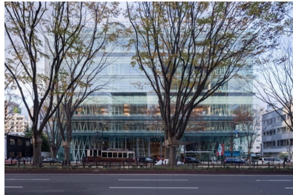
せんだいメディアテーク（2000）