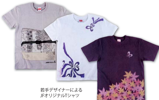
若手デザイナーによる JFオリジナルTシャツ