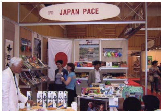
多くの来場者が訪れた日本ブース