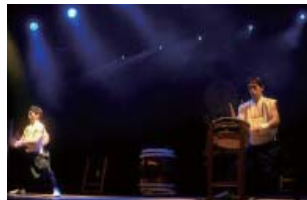
『は・や・と』アフリカ公演