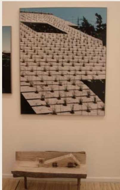
展示風景（ニラハウス）