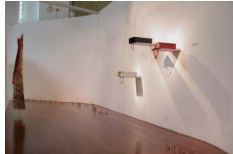
照屋勇賢『re.order』展示風景