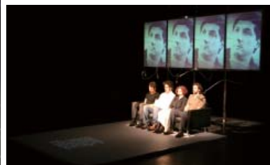
『これがぜんぶエイプリルフルールだったなら、とナンシーは』