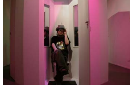
宇川直宏『Dr.Toilet's Rapt-up clinic』2006

オーストラリアの社会・文化を意識した 20 名／組の日本人作家の作品は地元の美術専門家にも高い評価を受け、美術関係者にさわやかな印象を残して、好評のうちに全事業を終了することができました。