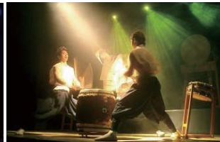
『は・や・と』アフリカ公演