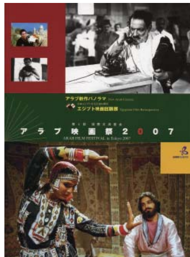
「アラブ映画祭2007」パンフレット

まで映画産業が存在しなかったサウジアラビアとイエメンからそれぞれ国産長編劇映画第1号となる『沈黙の影』（2005年）と『古きサナアの新しき日』（2005年）が出品されるなど、アラブ世界の映画状況の新たな息吹を感じることができました。