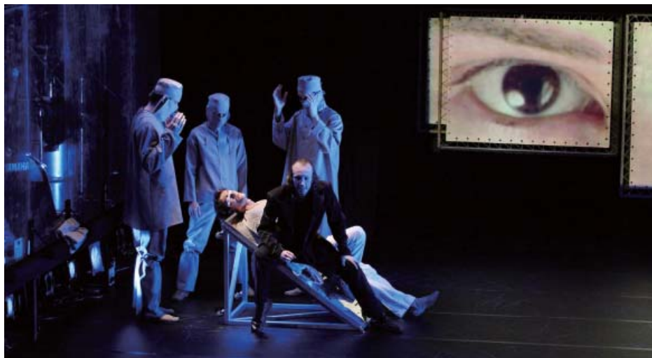
イルホム劇場（ウズベキスタン）『コーランに倣いて』日本公演のシーン

公演に加えて演出家のトーク、シンポジウム等を開催し、各作品の歴史的・文化的背景について理解を深めました。とくに中東について、2003年度より4年間にわたって集中的に紹介した作品は計9件に上ります。同地域の政治・社会状況を反映した批評性の高い作品群は、日本の観客に強いインパクトを与えました。