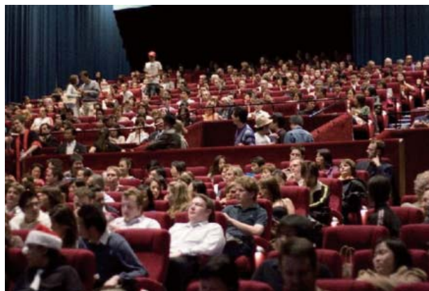
600席満員のオープニング