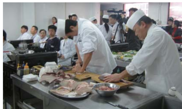
日本料理ワークショップ

漫画イベントでは『将太の寿司』『喰いタン』『ミスター味っ子』で韓国でも人気の料理漫画家寺沢大介氏を派遣し、一般市民を対象に韓国の人気料理漫画家ホ・ヨンマン氏との対談、上映会、原画展、サイン会等を実施しました。寺沢氏の『将太の寿司』は、韓国では主人公の「顧客本意」の姿勢が