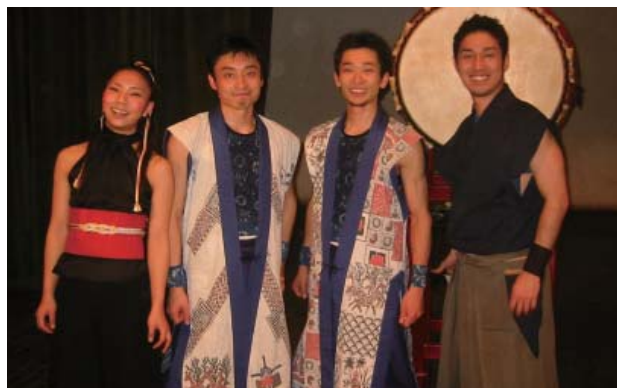
『ようそろ』中東・アフリカ公演

この他にも世界中で、日本の文化芸術の紹介にとどまらず相互理解を深める交流も行っています。