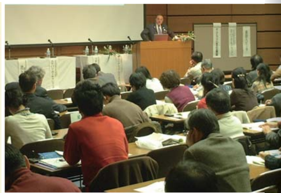
名古屋国際交流センターでのシンポジウム