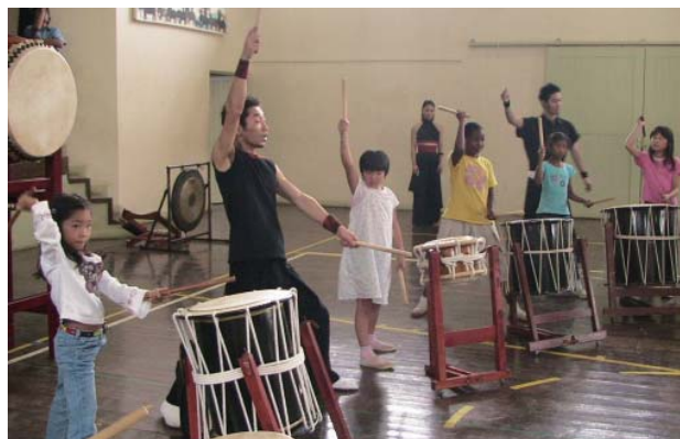
『ようそろ』ケニア、ナイロビ日本人学校でのワークショップ