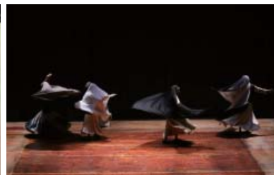
『囚われの身体たち』