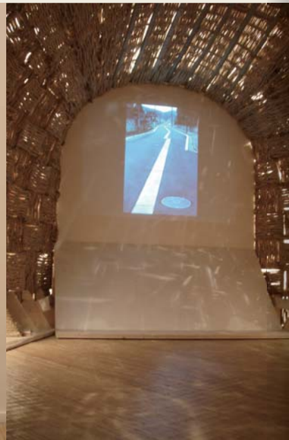
路上シアター内部