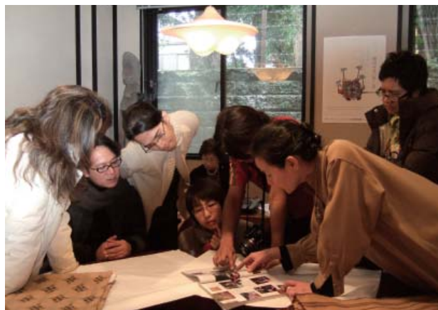
芭蕉布に魅せられて