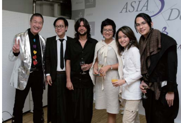
招へいされたデザイナー

ジャパンファウンデーションのロゴマークをモチーフに5名がデザインしたオリジナルTシャツ5種類が現在都内のミュージアム・ショップ等で販売されています。