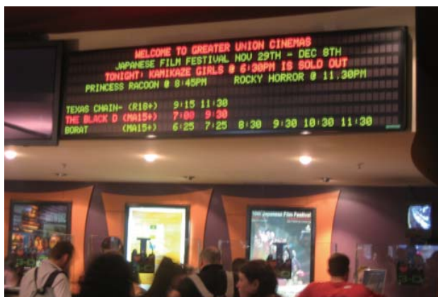
チケット完売サイン