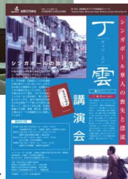
丁雲氏講演会のチラシ