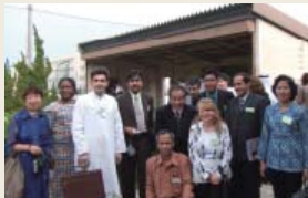
中高教員交流事業

55カ国から 205名の中学・高校の教員を招へいし、日本各地で学校訪問、文化施設等の視察や交流を行いました。