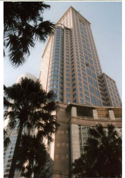
オフィスのあるチフリープラザビル