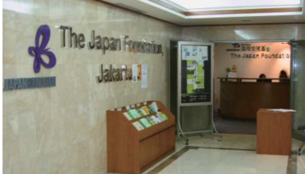
ジャカルタ日本文化センター

日本語分野では、当国派遣の日本語教育専門家およびジュニア専門家と連携して、現地日本語教師の質の向上を目指し、各種教師向け研修会および勉強会を積極的に支援しています。また、6月にはシンガポール、タイ、マレーシアおよびフィリピンの日本語教育関係者を集め、バンドンにて東南アジア日本語サミットを開催し、各国における課題等情報交換を行いました。その他、日本語学習者の学習意欲向上のため、高校生・大学生向け（社会人を含む）の日本語弁論大会の