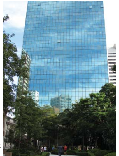
バラの館庭園(州文化財)とセンターのあるビル

これらの事業は2006年度から発行されている機関誌「TOBIRA（扉）」にて広報しています。