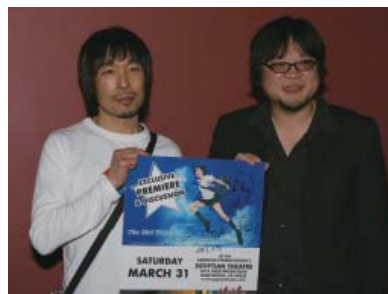
『時をかける少女』の細田監督と、AACHI & SIPAKのBum-JinJoe監督

また、高知県から手漉き和紙職人2名を招き、ロサンゼルス、デンバーといった大都市に加えアイダホ州やモンタナ州といった普段なかなか日本文化に触れる機会の少ない地方