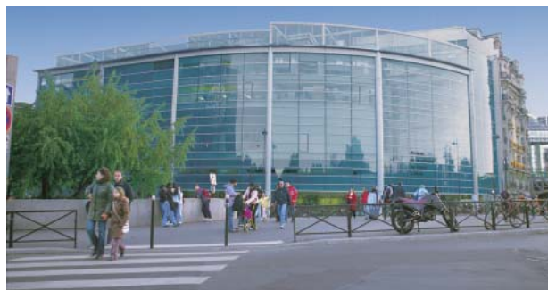
セーヌ河畔に立つパリ日本文化会館