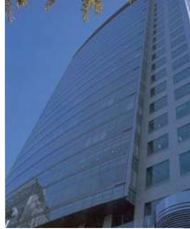
ソウル日本文化センターのあるビル

日本研究・知的交流分野では、JF出版協力プログラムによって助成され日本文化入門書としてマスコミ等から高い評価を得ている「日本文化の力」を執筆した著者たちによる連続講演会を同じく3月に開催し、ソウル日本文化センターのイオンホールは連日満員の盛況となりました。