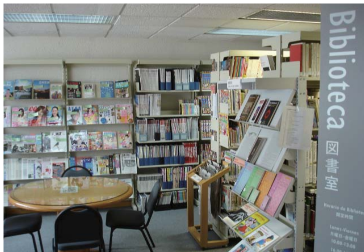
メキシコ事務所図書室

日本研究の分野では、メキシコを中心とするスペイン語圏の日本研究者による「イベロ・アメリカ日本研究学会」の設立を支援。今後ともその活動に協力することにより、中南米における日本研究の発展を目指します。