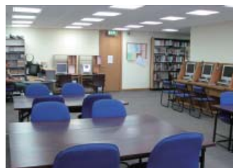
図書室の閲覧スペース