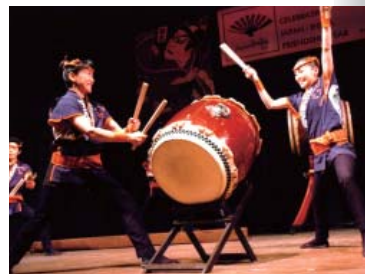
大江戸助六太鼓、デリー公演