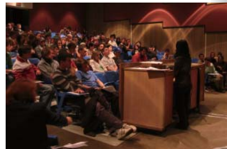
作家・多和田葉子氏（ブラウン大学で）