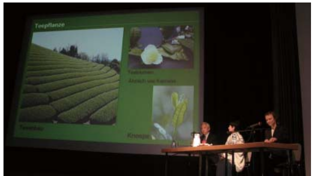
日本茶のレクチャー (2007年2月) 協力: 一保堂