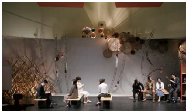
青年団「東京ノート」ジャカルタ公演