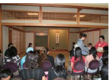
センター内 TATAMI ROOM でのお茶会