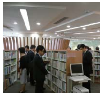
移転後リニューアルした図書館

また、2007年3月には北京・上海・西安の3都市にて音楽グループ Rin' のコンサートツアーを開催し、いずれの