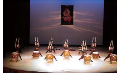
鬼島太鼓の公演風景（蔚山）