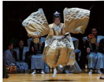
友好の日(7月24日)記念能公演 ©Joseph G. Uy Jr.