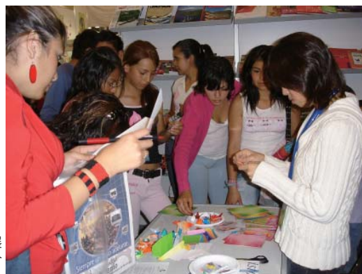
グアダハラ国際図書展で日本の図書を紹介