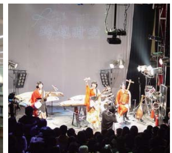
Rin' 三都市コンサートツアー

都市でも中国の若者を中心に大変な盛り上がりを見せました。2005年度に立ち上げた在中国日本人留学生によるネットワーク「留華ネット」は着実に発展し、幅広い地域で日中学生の交流の輪が広がりました。