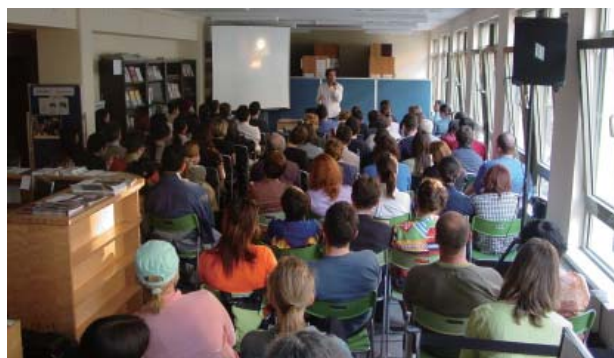
美術史家ペトラー二氏講演会 5月