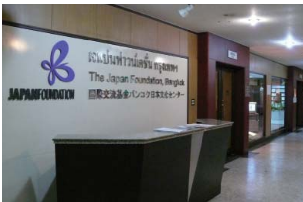
バンコク日本文化センター

日本研究・知的交流事業では、タイの国際交流基金元フェローらによる、日本の地域コミュニティー（高知県馬路村）の発展を紹介し、タイへの応用の可能性を考えるセミナーを開催しました。