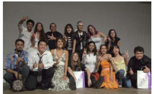
カラオケ日本語学習キャラバン 全国大会(サンパウロ) 入賞者の面々