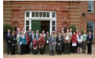
基金フェローのリユニオン会議