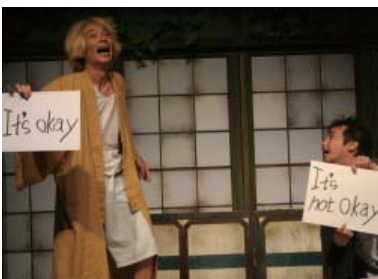
KUDAN Project 公演 「真夜中の弥次さん喜多さん」

日本語教育の分野では、教育省が行う中等教育用のシラバス・教科書の作成、教員養成事業に協力しています。また日本語教師対象のセミナーや、中上級向けの日本語講座を引き続き実施しました。