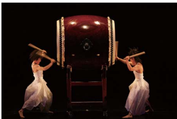
和太鼓タイ公演