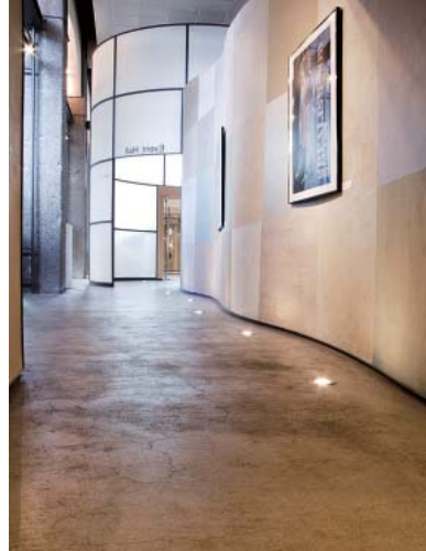
明るく開放感のあるホール入り口

日本語教育の分野では、日本語教育アドバイザーをアルバータ州に派遣し、カナダ全体における日本語教育の促進に力を入れているほか、テレビ会議方式による遠隔地日本語教育への支援、日本語教師向けのワークショップ実施を通じた教師の支援などを行っています。