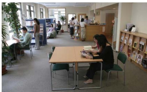
ブダペスト事務所図書館閲覧室

事務所が市の中心地に移転し、またスペースが広がったことから、図書館閲覧室を利用して、月に1回定期的にハンガリー人による日本関係の講演会を行うようにしましたが、11月には日本滞在記を出版した有名なコメディアンに講演をお願いし、多くの聴衆を集めることができました。図書館の来館者も増え、昨年度と比べて大幅な人数増に恵まれましたし、日本語講座はクラス数を増やし8クラスを週2回運営し、受講者数も大幅に増やすことができました。