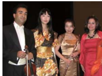
日本人・エジプト人による室内楽

また、中東域内拠点事務所として、アンマンにおいて在ヨルダン日本大使館の共催により日本映画祭を実施し、のべ500名以上の観客を集めました。