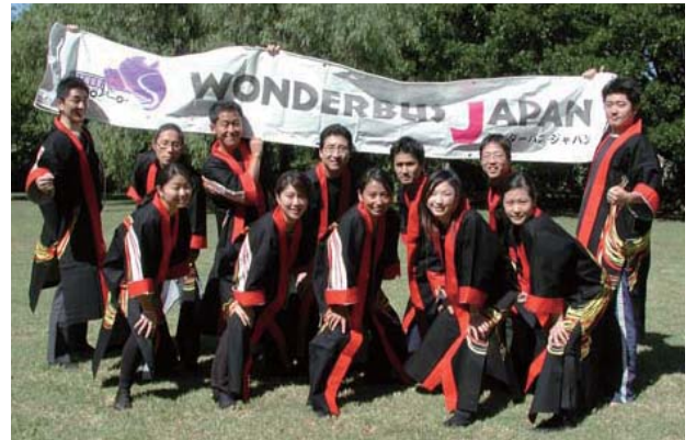
ワンダーバス・ジャパンのクルー

れました。日本会場（早稲田大学）との間をインターネット回線で中継。毎回ほぼ会場は満席となり、4回を通じて約1,000名の参加を得ました。