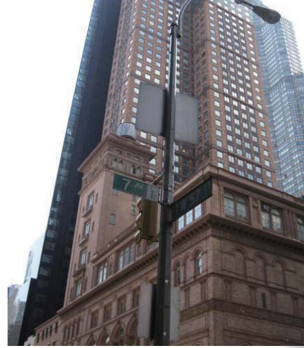
カーネギー・ホールの隣が ニューヨーク事務所のあるビル

さらに、米国アジア学会年次総会など国際会議・シンポジウムの機を捉え、日本研究者のネットワーク形成を積極的に支援しました。