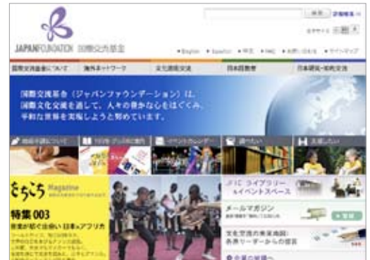
国際交流基金 HP より

問い合わせ：TEL. 03-5369-6086 / E-mail. Lib@jpff.go.jp