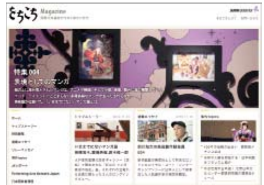
ウェブサイト「をちこち Magazine」より