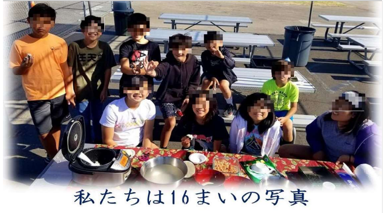
私たちは16まいの写真