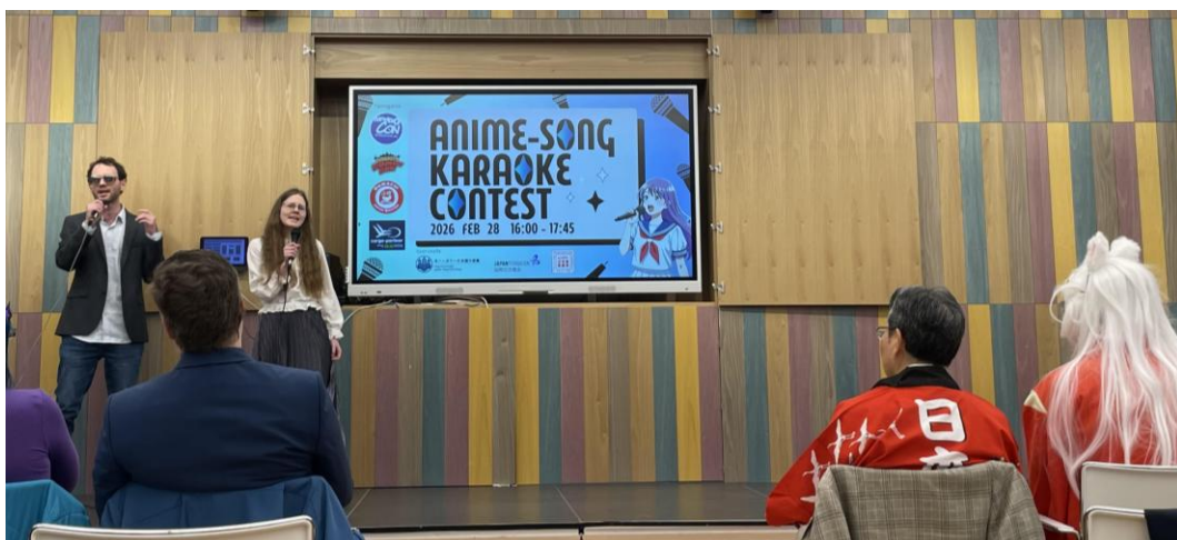
アニソン・カラオケコンテスト（2026 年 2 月 28 日）

木村徹也駐ハンガリー大使による激励、JFBP 日本語専門家による大人気アニメの名言を交えた講評、日本語教師会による学習奨励のメッセージが会場を盛り上げました。日本の関連企業とハンガリーのサブカルエキスポ主催団体が協賛し、アニソンドダンスやパラパラのパフォーマンスも行われ、それぞれの場所でさまざまな形で日本と関わっていた方々が一堂に会す機会となりました。出場者の中には JF 講座の受講者もいて、歌手になりきって歌う新たな一面に驚かされました。また、長く日本語を使う場を離れていたという日本語専攻の学習者から、こんな機会を待っていたという声も聞かれました。