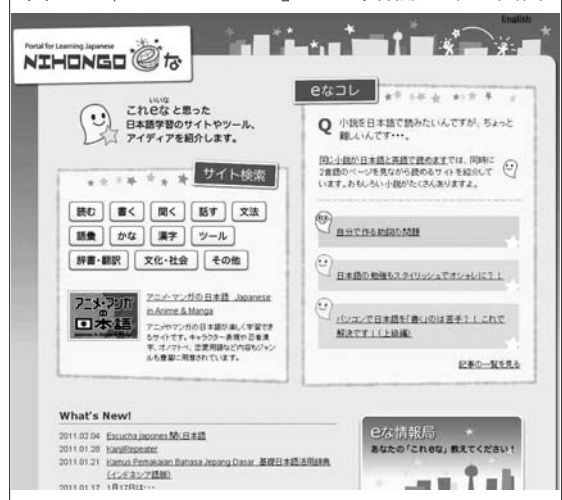
図1 「NIHONGO e な」の日本語版トップ画面

「サイト検索」は、日本語学習に役に立つと思われる個々のウェブサイトやツールについて紹介するものである。トップ画面から、「読む」「書く」「聞く」「話