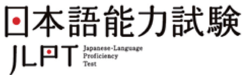
図5 日本語能力試験ロゴタイプ

試験の改定に合わせて、新たに、日本語能力試験のロゴタイプを定めました。一般公募して集まった、825作品の中から選んだものです。このロゴタイプを使って、新しいデザインのパスターを作り、公式ウェブサイト（www.jlpt.jp）をリニューアルしました。公式ウェブサイトには、新試験についてもっとくわしい説明がのっています。新試験のレベル別問題例や日本語教師向けの資料集などもありますので、ぜひ利用してください。