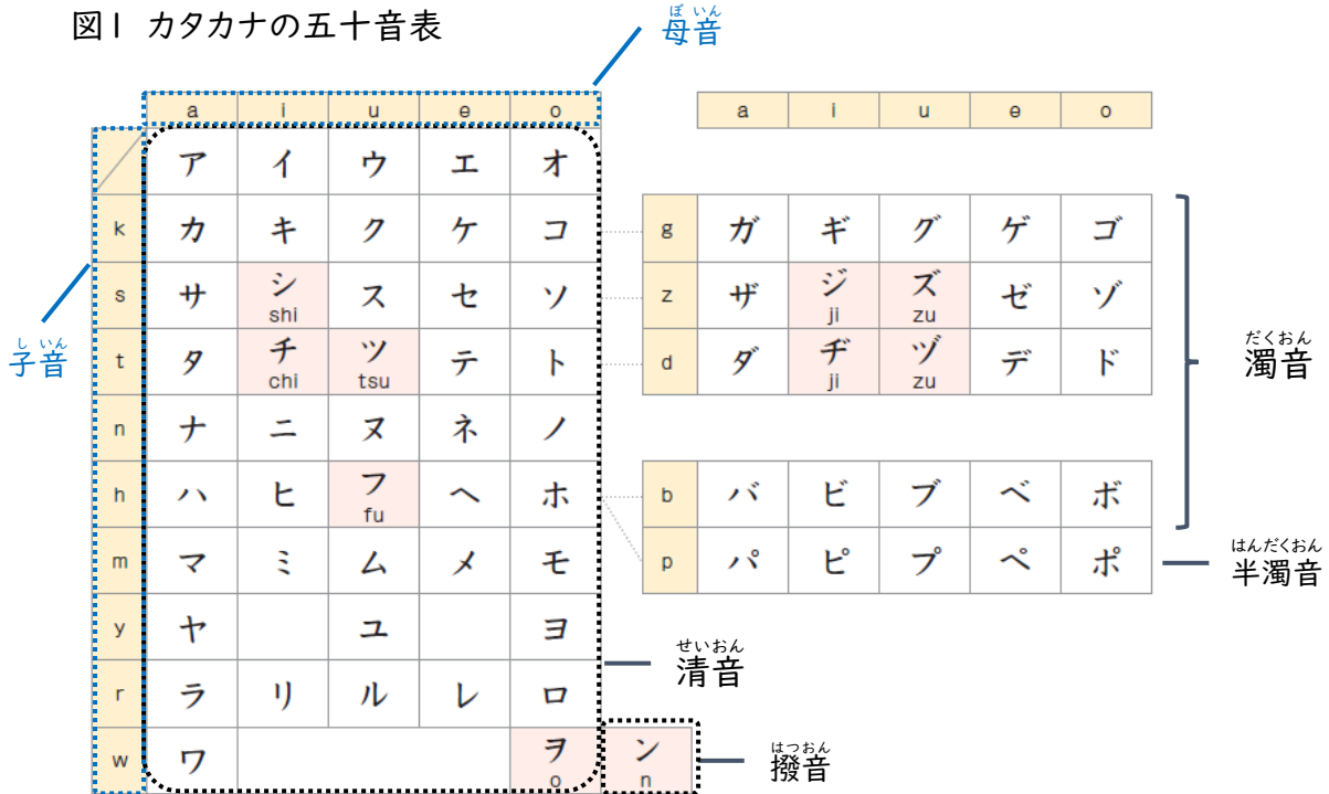
図1 カタカナの五十音表