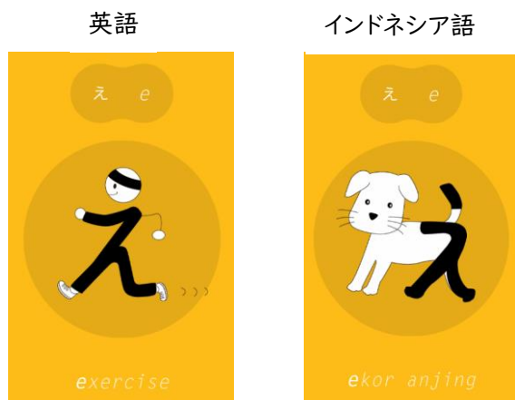
図 4 連想法の例(『HIRAGANA Memory Hint』)

たとえば、図 4 は国際交流基金の『HIRAGANA Memory Hint』というアプリ教材の例ですが、ひらがなの「え」は英語ではエクソサイズ(運動)の「え」、インドネシア語では「Ekor anjing(犬のしっぽ)」の「え」というように絵を見ながら文字の形と音を覚えます。