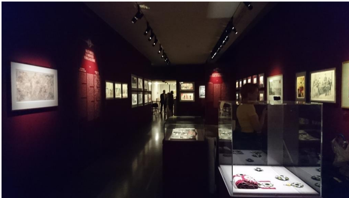
「明治」展入り口付近の展示風景（ギメ東洋美術館）