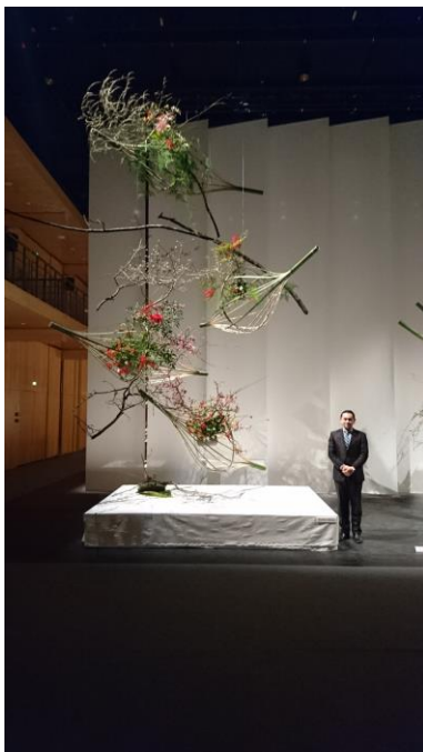
一葉式いけばな家元の作品

作品はいずれも力作、傑作揃いでしたが、7m近い巨大オブジェから豪快、勇壮、典雅、流麗、独創的なものまで、それぞれの流派の渾身の作品が大ホールに展示されました。この4日間は会館中が美しい花のオブジェで満ちあふれ、パリ日本文化会館が花々のほのかな芳しい香りで包まれました。