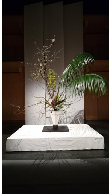
池坊次期家元の作品