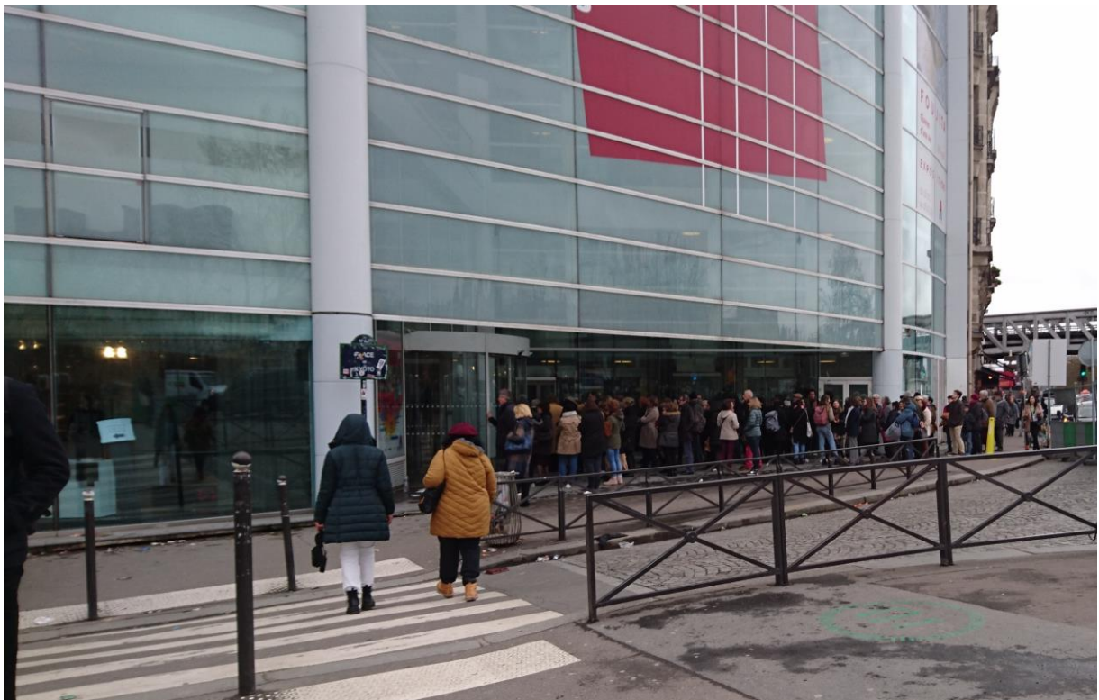
パリ日本文化会館前で藤田展の開場を待つ人々（2019年2月8日12時）

この「藤田」展には、3月9日（土）まで（日、月、祝日休館）に36,389人が入場しました。会期後半になって平日でも一日千人前後の来場者を数え、入場制限をかけるほどに盛況となっています。本展は3月16日（土）まで開催されますので来場者が4万人に達するのは確実とみられます。