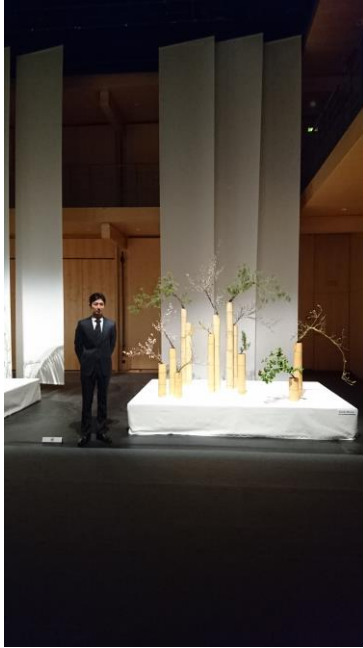
未生流家元の作品