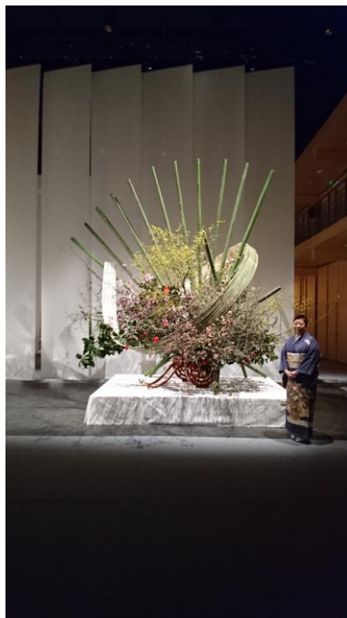
草月流家元の作品