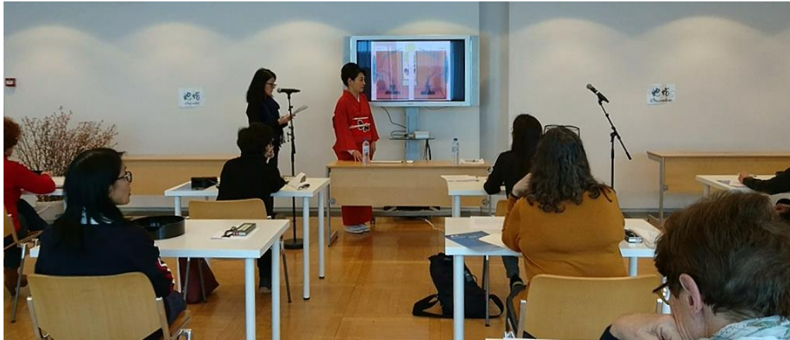
レセプションホールで行われたワークショップの様子（講師は池坊専好さん）

そして5階のレセプションホールでは毎日家元・次期家元による稀有で贅沢なワークショップが開かれ、生け花の理論と実践の授業が開催されました。