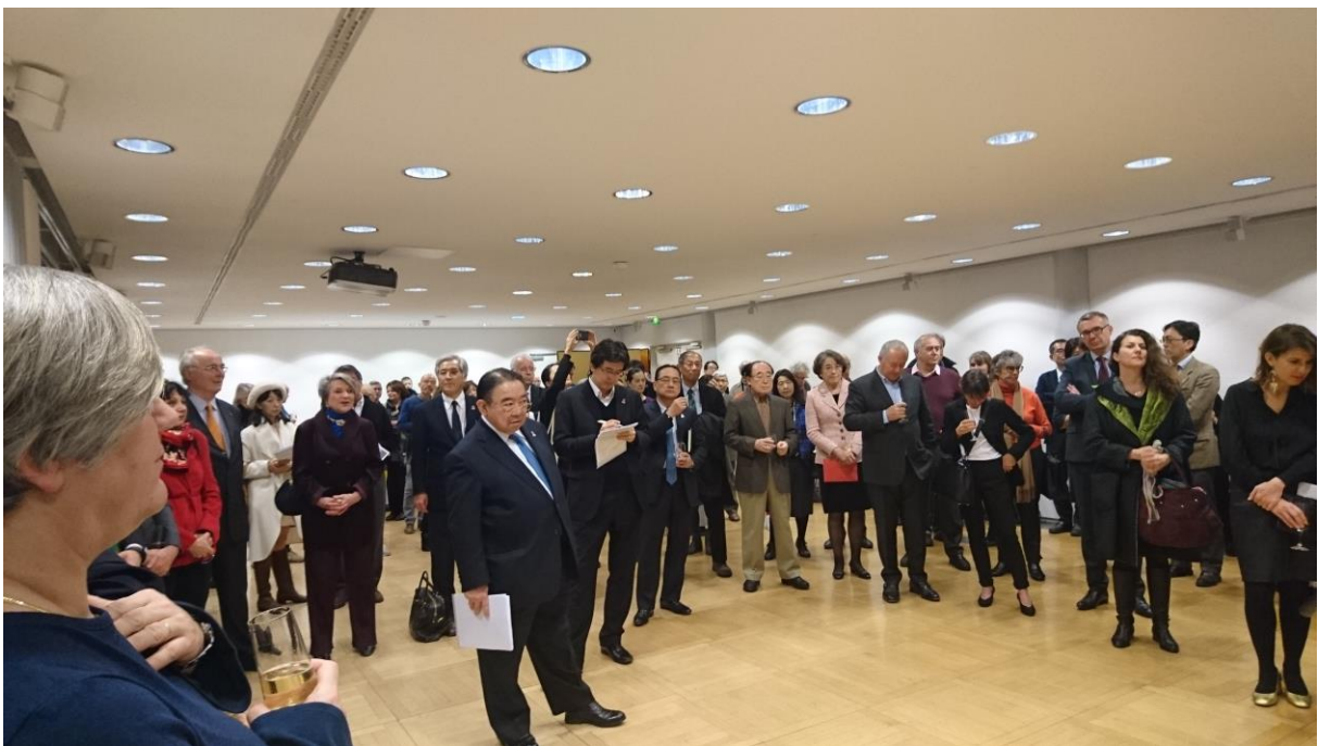
藤田展のオープニング・レセプション

「ジャポニスム2018」の目玉企画の一つとして2019年1月16日から始まったパリ日本文化会館における「藤田嗣治：生涯の作品（1886 - 1968）」展（以下「藤田嗣治：生涯の作品」展）は、会場の規模の制約から展示数が36点と少ないながら、1914年から晩年までの各時代の文字通り代表作を集めた珠玉の回顧展となっています。15日に実施したプレス内覧会にはプレス関係者が67人来場し、既にフィガロ紙など主要紙に大きな記事が掲載されるなど、好評裡にスタートしました。15日夕刻に行われたレセプションには木寺駐仏日本大使ご夫妻をはじめ、パリ日本文化会館運営審議会の委員である、クリスチャン・ソテール元経済財政産業大臣ご夫妻、フランス学士院のロベール・ピット倫理・政治学アカデミー終身幹事、美術史家・美術評論家で、本展実行委員でもある高階秀爾西洋美術振興財団理事長、尾崎正明茨城県近代美術館館長、そして本展のコミッショナーである美術史家の林洋子氏、同ソフィー・クレブス氏（パリ市立近代美術館学芸員）らが参列しました。