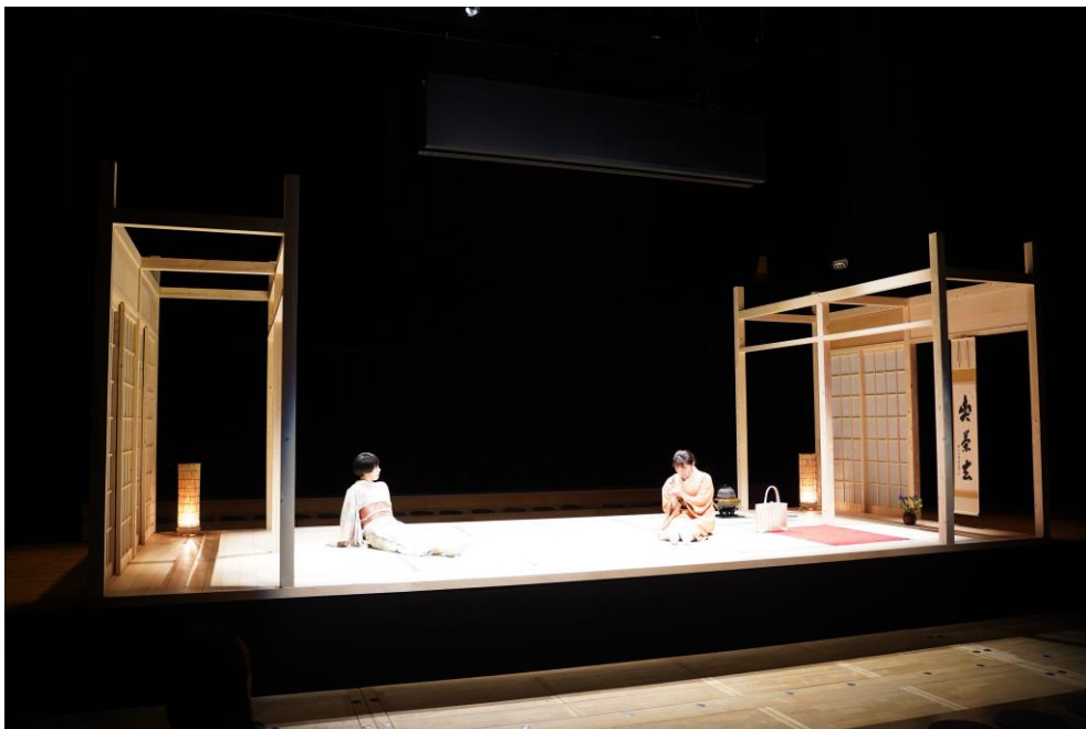
「お点前ちょうだいいたします」のワンシーン