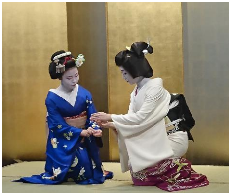
芸舞妓さんの踊りのワンシーン

パリ日本文化会館では日本の地方の魅力紹介にも力を入れています。その一環として、10月16日(水)に関西広域連合に協力し、地上階で芸舞妓の踊りや宇治茶の振舞いなどを通じて、関西地域への観光誘致イベントを開催しました。