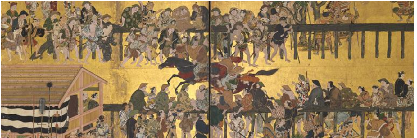
《賀茂競馬図屏風》(部分) 1615-50年、クリーブランド美術館