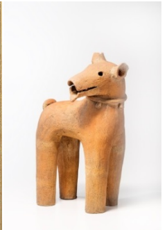
《埴輪犬》 古墳時代 6-7 世紀 ミホミュージアム ©山崎兼慈