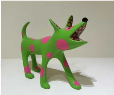
草間彌生 《SHO-CHAN》 2013 年 ©YAYOI KUSAMA. Courtesy of Ota Fine Arts Tokyo/Singapore/Shanghai