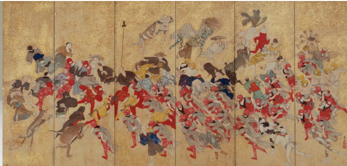
小澤華嶽 《ちようちよう踊り図屏風》 江戸時代 19 世紀 細見美術館