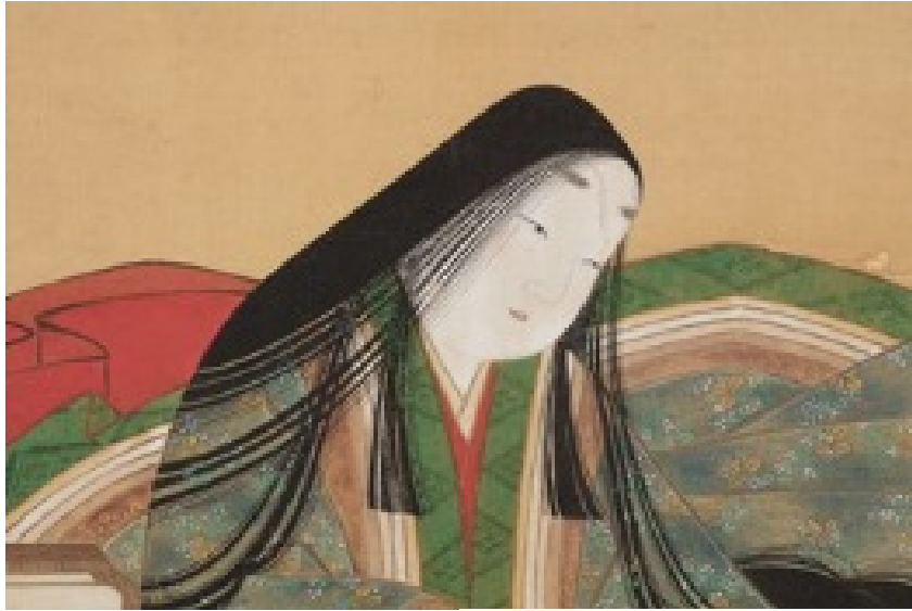
土佐光起筆《紫式部像》（部分） 17世紀、石山寺蔵