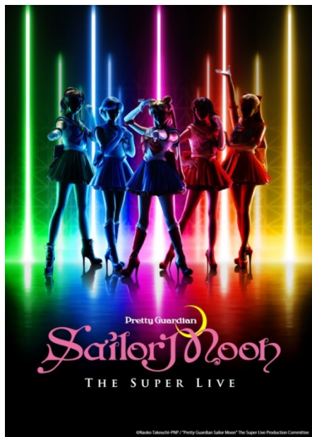
©武内直子・PNP/"Pretty Guardian Sailor Moon" The Super Live 製作委員会