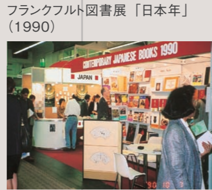
フランクフルト図書展「日本年」 (1990)