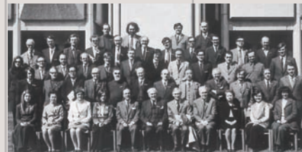
欧州の日本研究者集会 (1973)