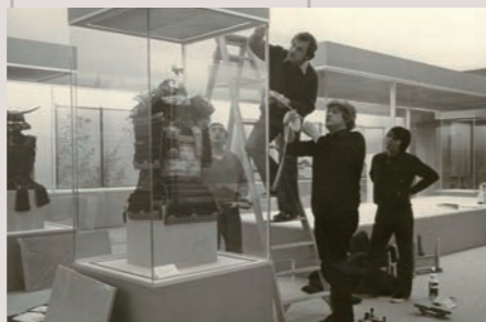
ロンドンでの「江戸大美術」展 (1981)