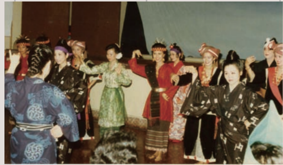
沖縄舞踊東南アジア公演 (1986)