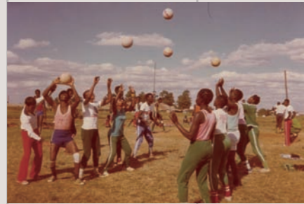
アフリカでのスポーツ指導 (1980 頃)