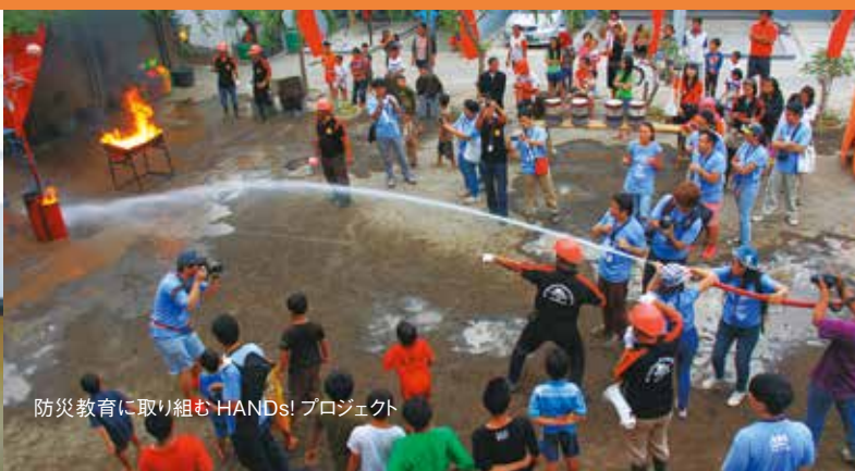
防災教育に取り組むHANDs! プロジェクト