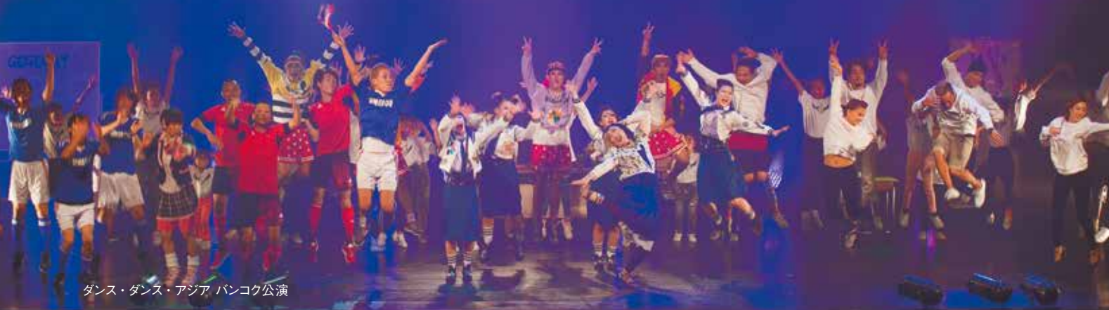
ダンス・ダンス・アジア バンコク公演