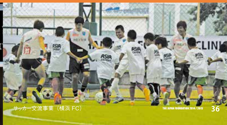
サッカー交流事業(横浜FC) THE JAPAN FOUNDATION 2014/2015 36