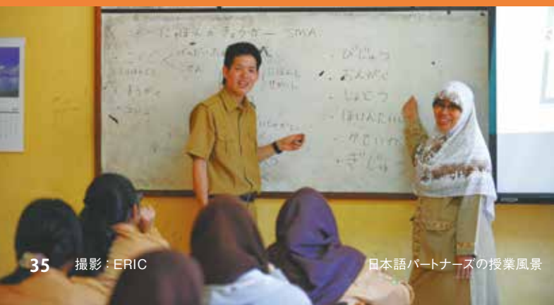
35 日本語パートナーズの授業風景

アジアセンターはアジア諸国を中心に、例年の倍以上となる約50人の舞台芸術の関係者(劇場やフェスティバルのディレクター、プログラマー、プレゼンター等)を独自にTPAMに招へいしました。さらに今後の日本とアジアの協働のためのプラットフォームとして、芸術祭の調査や舞台芸術家へのインタビュー特集も実施しました。TPAMでの出会いがきっかけとなった企画が、既に様々な形で実現しています。