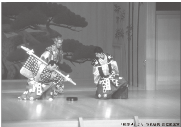
「棒繰り」より