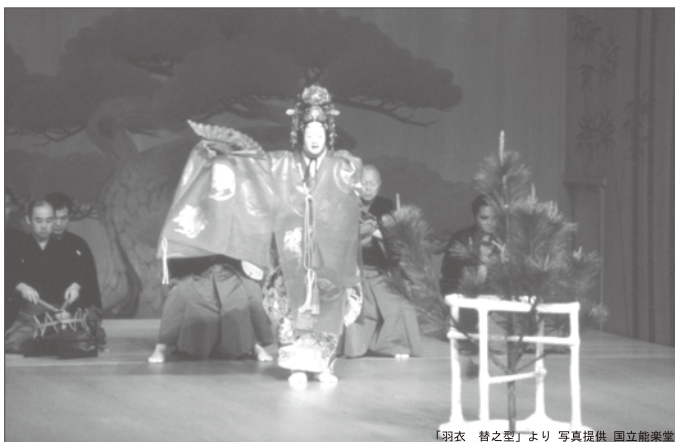
「羽衣 替之型」より