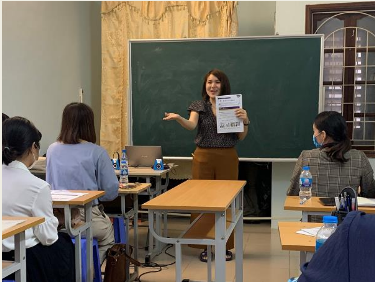
ベトナムの民間日本語センターでの 日本語教材『いろどり』説明会