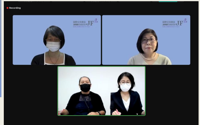
日本語教育セミナー トークセッション

国際交流基金バンコク日本文化センターが、在タイ日本大使館と共催した「特定技能制度を活用した来日就労のための総合オンラインセミナー」