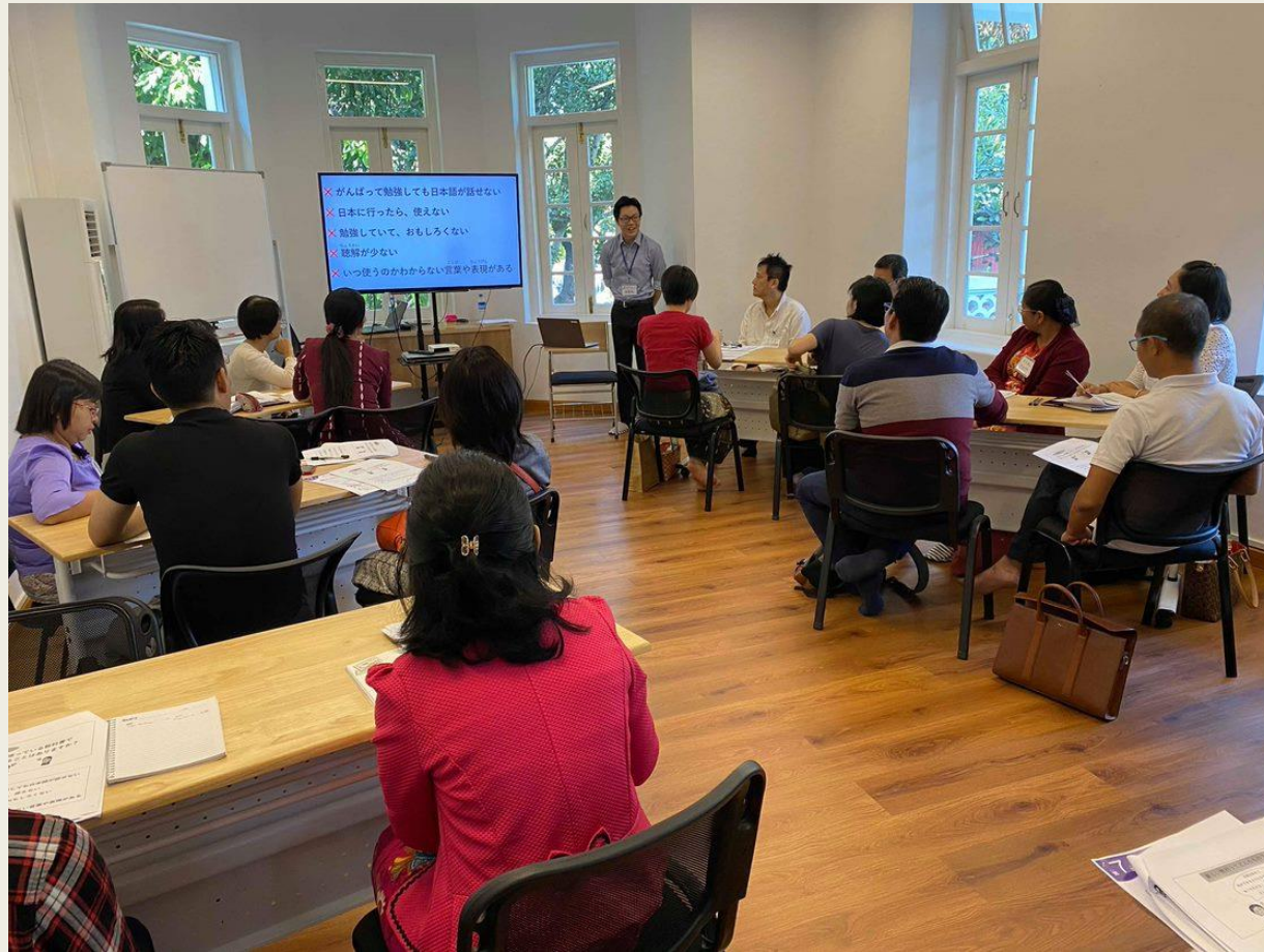
国際交流基金ヤンゴン日本文化センターによる 生活日本語、JFT-Basic紹介セミナーの様子