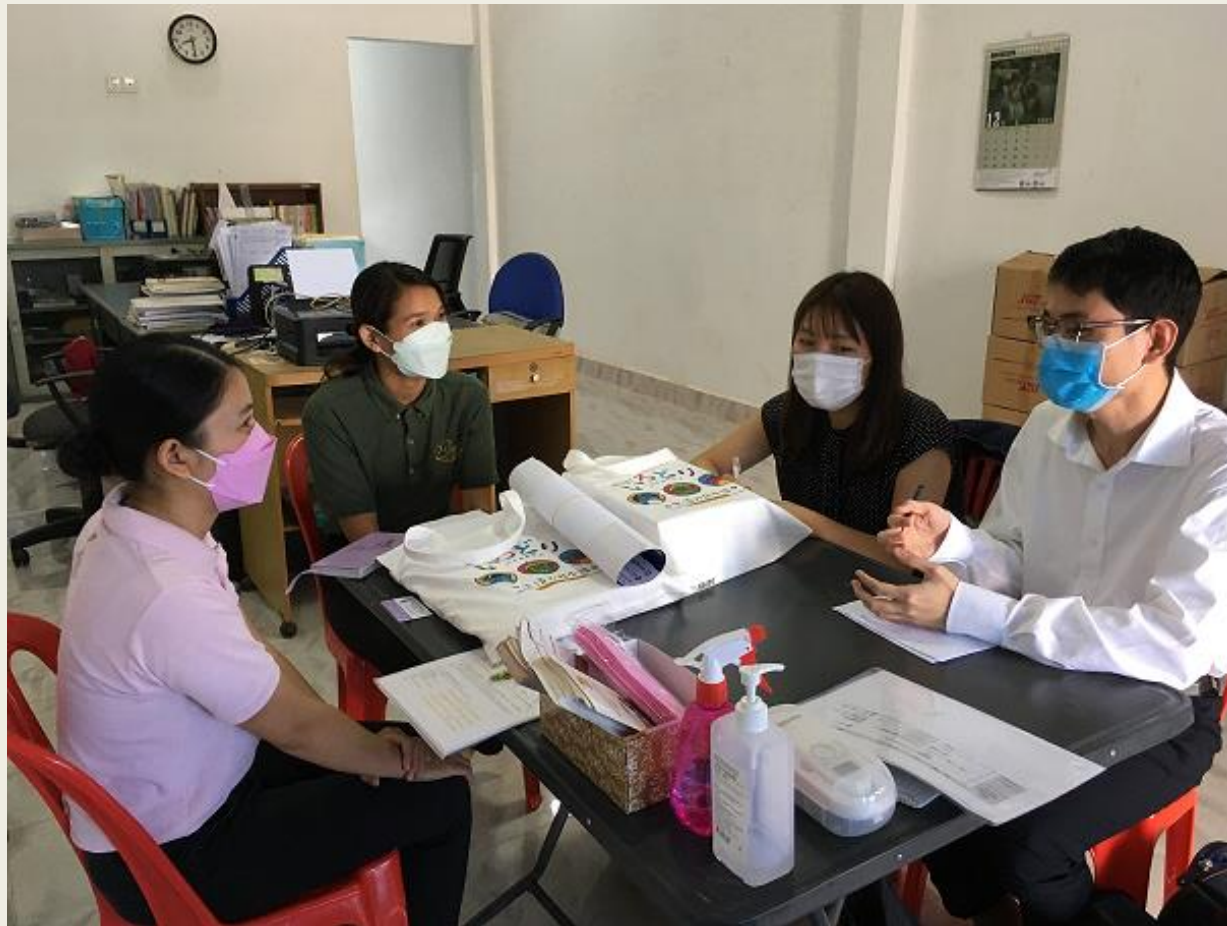
国際交流基金プノンペン連絡事務所スタッフによる 日本語教育機関への訪問