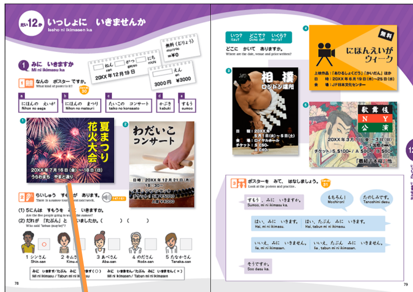
図1:『まるごと 入門A1』第12課 P78-P79