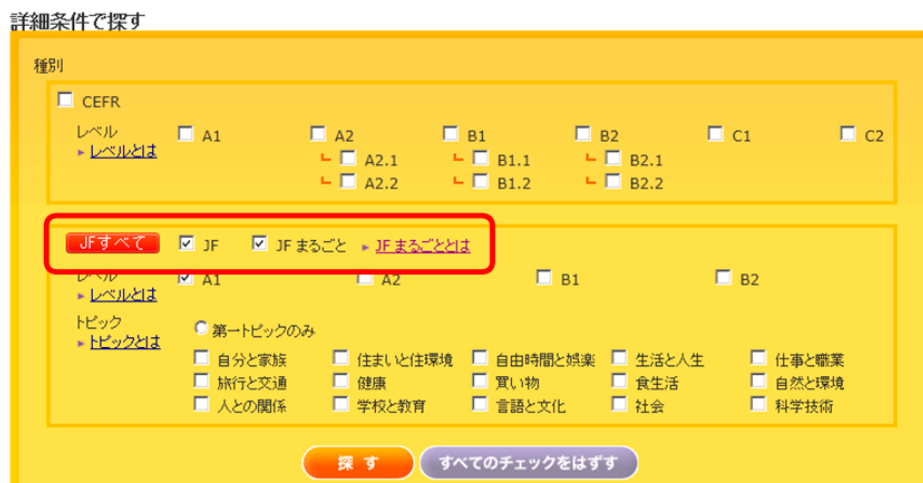
「みんなの Can-do サイト」の新しくなった検索ページ

“まるごと Can-do” は「みんなの Can-do サイト」の検索ページで「JFまるごと」にチェックを入れると検索することができます。また、今回の Can-do の追加に伴って、「JFすべて」ボタンが検索ページに付きました。