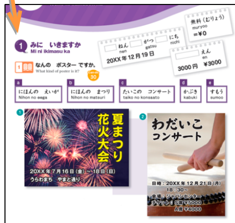
図2:『まるごと 入門A1』第12課 Can-do30の活動例