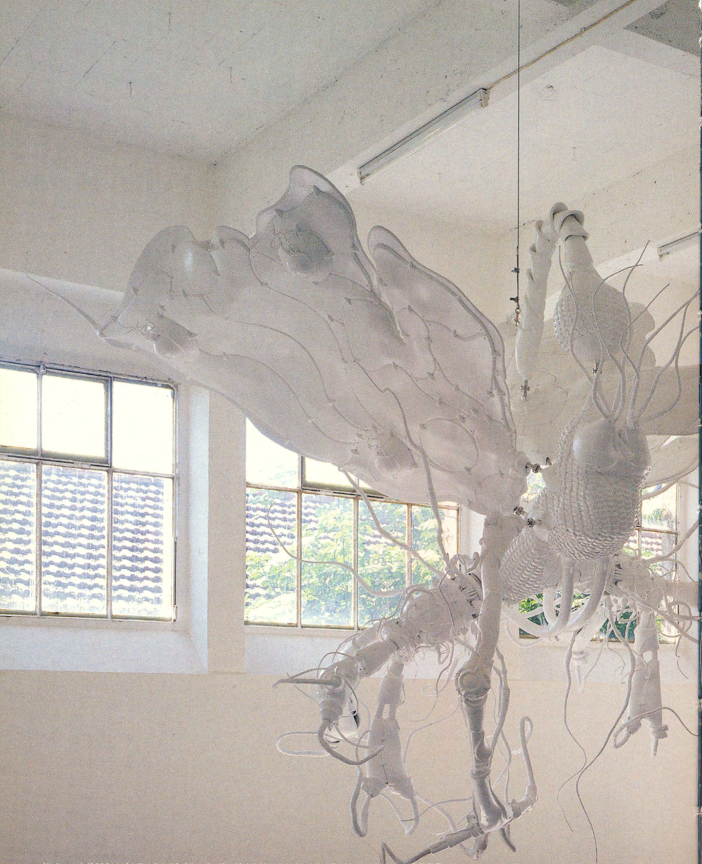
《サイレーン》/2000(左)[本展出品作品]、《サイボーグW3》/1998(中央)、《サイボーグW2》/1998(右上)の展示風景、コンソルティウム、ディジョン、2002 Installation view of Siren /2000 (left) [exhibited work], Cyborg W3 /1998 (center), and Cyborg W2 /1998 (above right) at Le Consortium, Dijon, 2002