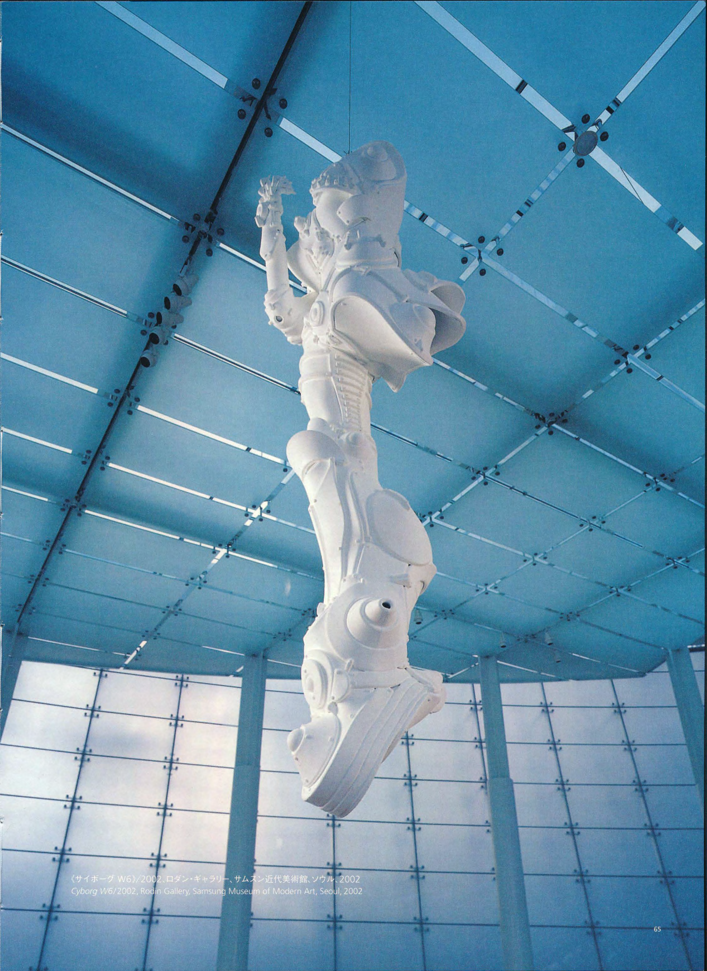
〈サイボーグ W6〉/2002、ロダン・ギャラリー、サムスン近代美術館、ソウル、2002 Cyborg W6/2002, Rodin Gallery, Samsung Museum of Modern Art, Seoul, 2002