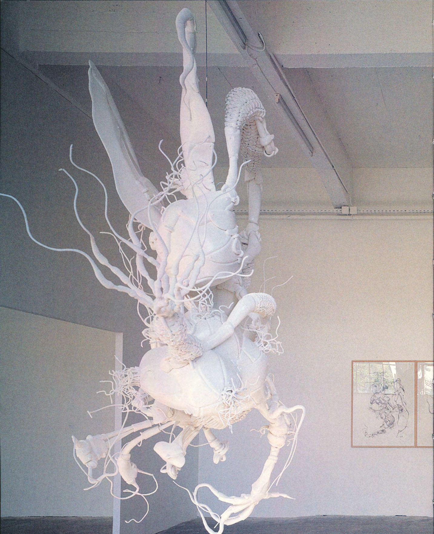
《アマリリス》/1999(左)、《モンスター・ドローイング No.1-6》/1998(中央)[本展出品作品]、《サイボーグ W4》/1998(右)の展示風景、コンソルティウム、ディジョン、2002 Installation view of Amaryllis /1999(left), Monster Drawings No. 1-6 /1998(center) [exhibited works], and Cyborg W4 /1998(right) at Le Consortium, Dijon, 2002