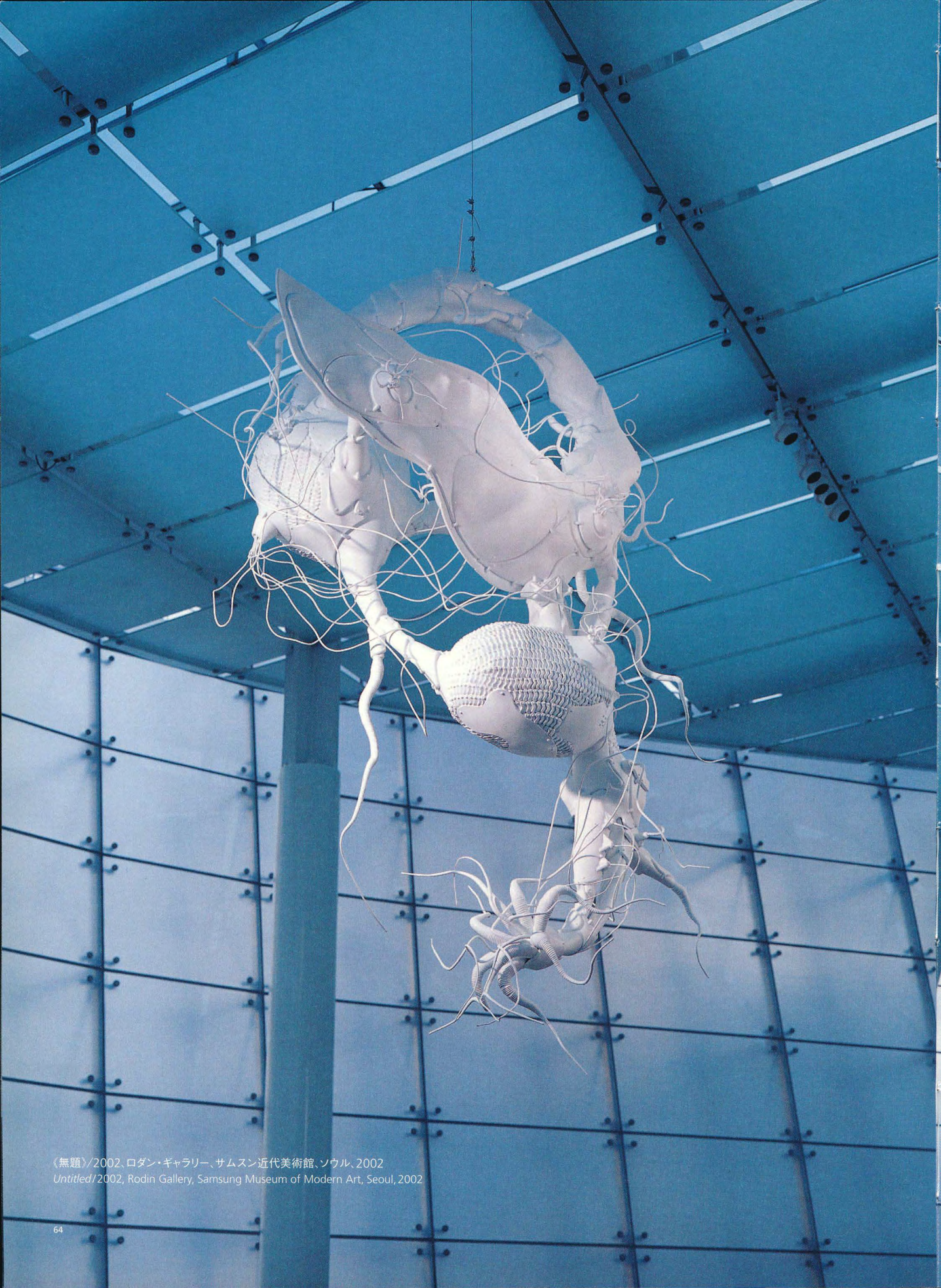
《無題》/2002、ロダン・ギャラリー、サムスン近代美術館、ソウル、2002 Untitled /2002, Rodin Gallery, Samsung Museum of Modern Art, Seoul, 2002