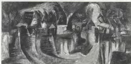
FIG.06 Syed Ahmad Jamal, Sungai Batu Pabat (La rivière Batu Pabat) , 1957