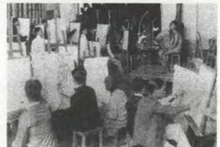
FIG. 02 Un cours à l'École des beaux-arts de l'Indochine, c.1930