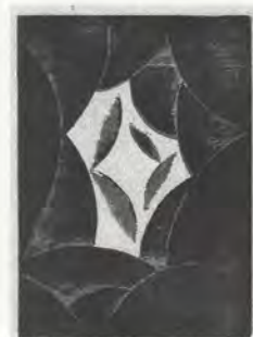
FIG. 04 Onchi Kôshirô, Moment lumineux, 1915