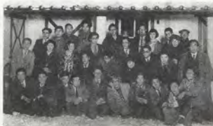
FIG. 04 Atelier de Fujita Tsuguharu, Tôkyô, 1936