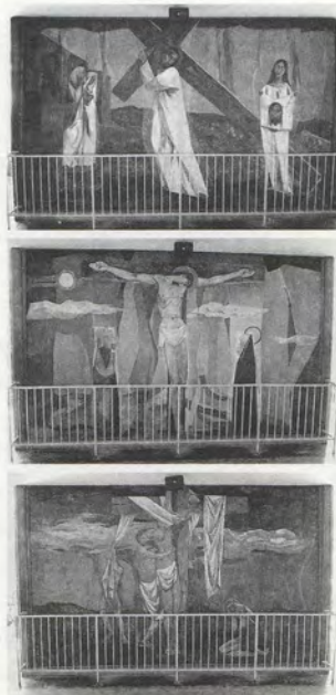
FIG.05 Vicente Manasala, Stations de la Croix , 1957