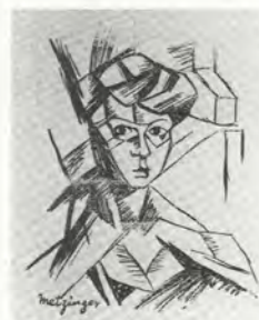
FIG. 01 Ishii Hakutei, Copie d'après Tête de femme de Jean Metzinger, 1911