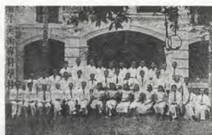
FIG.03 Premiers étudiants diplômés de l'Académie des beaux-arts de Nanyang, 1940