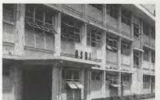
FIG.04 Académie indonésienne des arts visuels (ASRI), Yogyakarta, années 1950