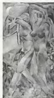
Fang Ganmin, Son d'automne , 1933