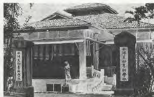
FIG.02 Premiers locaux de l'Académie des beaux- arts de Nanyang, fin des années 1930