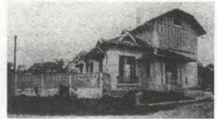
FIG. 01 Vue d'ensemble de l'École des beaux-arts de l'Indochine, 1929