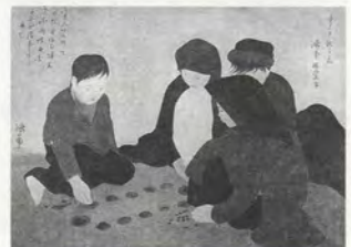
FIG. 03 Nguyen Phan Chanh, Jeu d'O An Quan , 1931