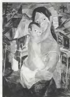
FIG.03 Vicente Manansala, La Madone des bidonvilles , 1950