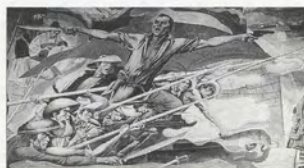
FIG.06 Carlos Francisco, Les luttes des Philippines à travers l'Histoire , 1964