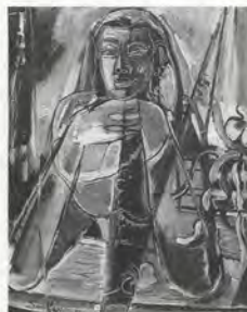
FIG.04 Cheong Soo Pieng, Femme malaise , 1950