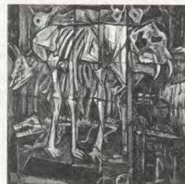
FIG.05 Chen Wen Hsi, Au musée , années 1950