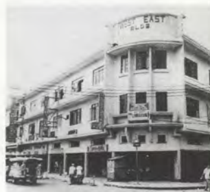
FIG.04 Façade de la Philippine Art Gallery (PAG), années 1950