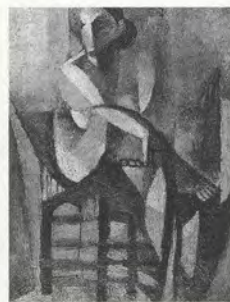
FIG.06 Fua Hariphitak, Bleu-Vert , 1956