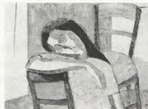
FIG.08 Chalood Nimsamer, Jeune fille endormie , 1960