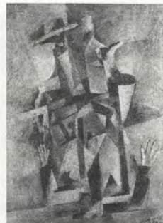
FIG.07 Sompot Upa-In, Le politicien , 1958