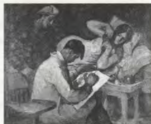
FIG.01 Victorio Edades, Le Dessinateur , 1928