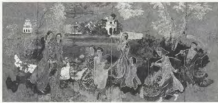
FIG. 04 Nguyen Gia Tri, Jeunes filles au lac Hoan Kiem , c.1939