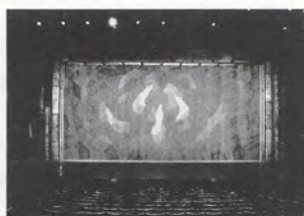
FIG.07 Hernando R. Ocampo, Genèse au Centre culturel des Philippines, 1969