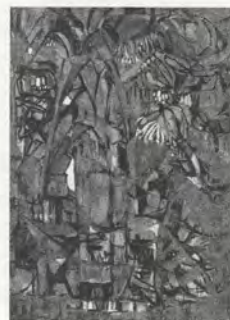
FIG.07 Tay Hooi Keat, Paysage végétal , 1959