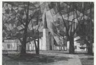
FIG.03-1 Ries Mulder, Eglise de Bandung , années 1950