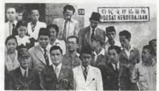
FIG.02 Le Keimin bunka shidôsho, 1943