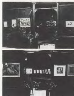
FIG. 03 Vue de la salle de l'exposition Der Sturm - gravures sur bois au Musée Hibiya, 1914