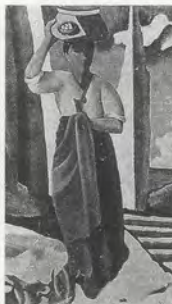
FIG. 03 Kim Whan-ki, Quand l'alouette chante , présentée à l'exposition Nika-kai au Japon, 1935