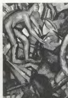
Lin Fengmian, Composition , 1934