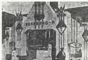
FIG. 02 Première exposition d'art Joseon, 1922