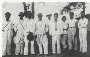
FIG.01 Membres de la Société des artistes chinois de Singapour, 1937