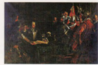
FIG. 06 Juan Luna Le Pacte de sang 1885 huile sur toile National Museum of the Philippines

moitié gauche du buste de Legazpi ressort en pleine lumière. L'observateur ne fait qu'un avec le dos de Sikatuna, et par empathie se retrouve face à Legazpi, dont seule la table le sépare. L'époque à laquelle Luna peignit cette œuvre marque les débuts du mouvement pour l'indépendance des Philippines, alors colonie espagnole. Dans cette œuvre imposante au format monumental (200 × 300 cm), où l'ombre et la lumière servent à donner une intensité dramatique, l'aspiration à l'égalité face la puissance coloniale vient se superposer à un événement historique ancien de trois siècles. L'œuvre est portée par l'aspiration du peintre à immortaliser l'entrée dans une nouvelle phase de l'histoire 12 .