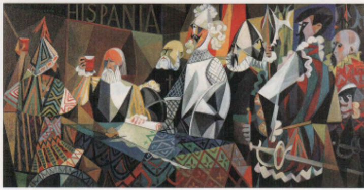
FIG. 05 Vicente Manansala D'après «Le Pacte de sang» de Juan Luna 1962 huile sur toile Fukuoka Asian Art Museum