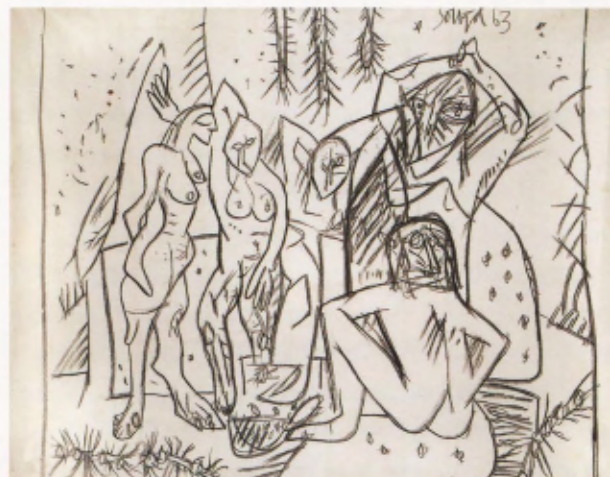
FIG. 01 F. N. Souza Ebats 1963 huile sur toile Vinit Kumar Jain, Kumar Gallery