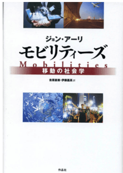
ジョン・アーリ『モビリティーズー移動の社会学』（左：英語版、右：日本語版）