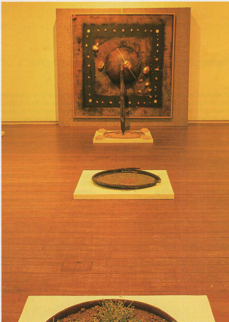
ベート・ヨック・クアン〈人間と環境〉1988年