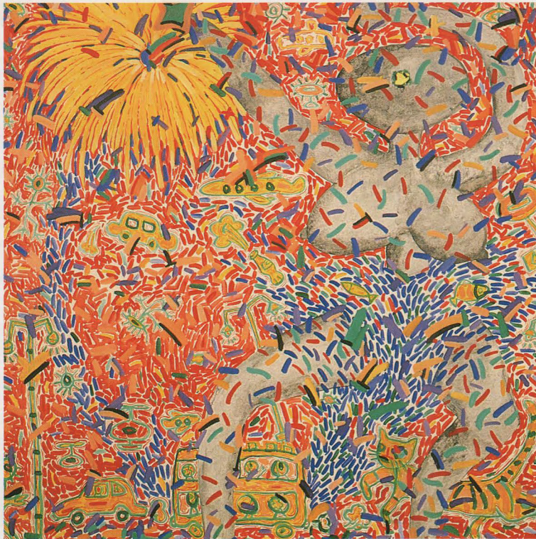
リム・ポー・テック 〈スリリングな都市#1〉1989年